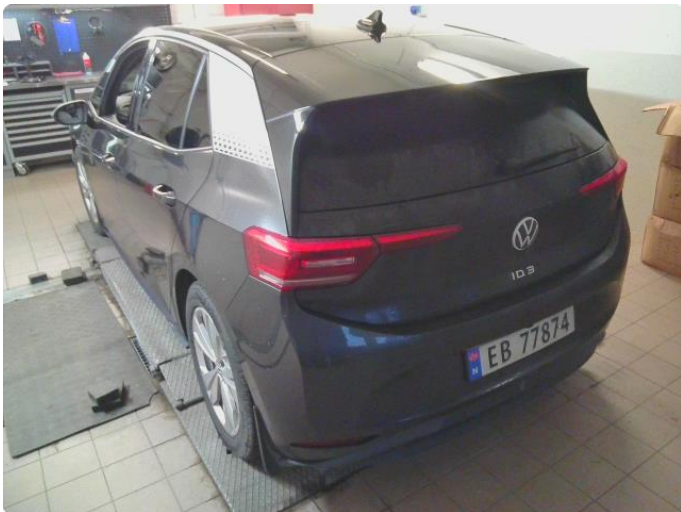
2.1 Div steinsprut og riper finnes