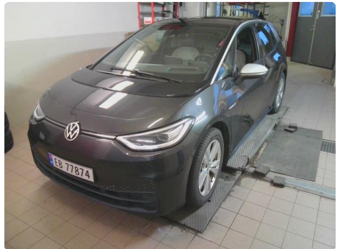
2.1 Div steinsprut og riper finnes