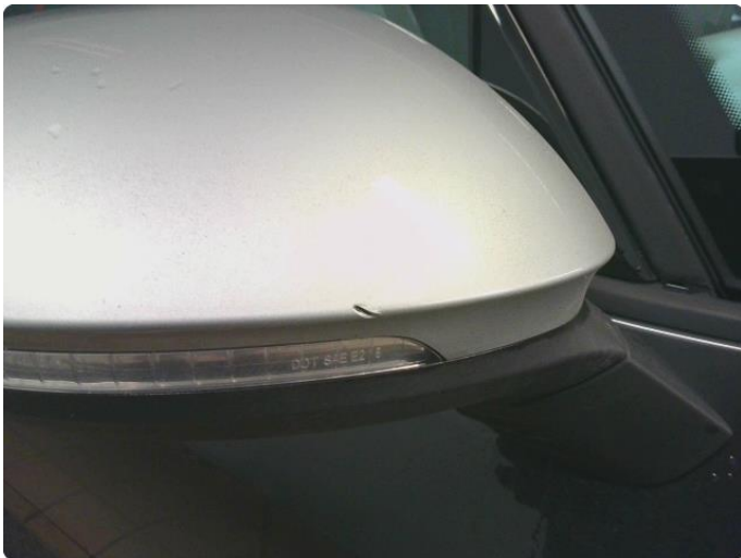
1.1 Speilhus riper