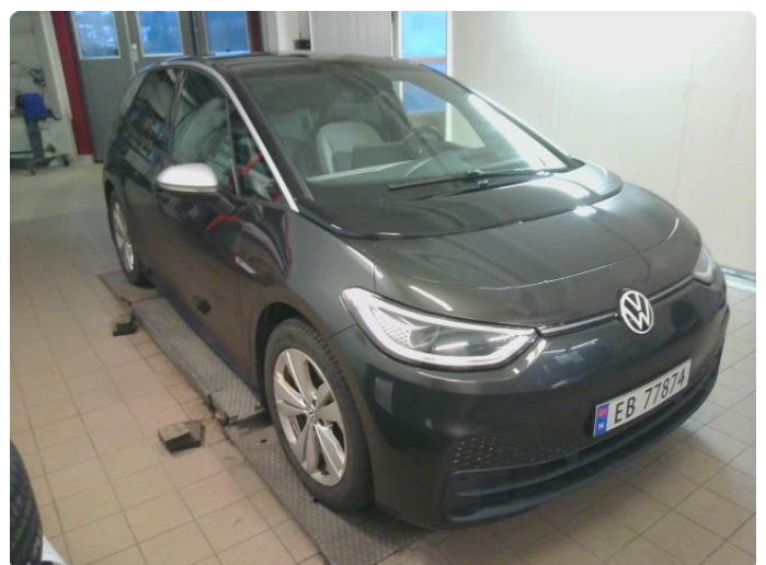
2.1 Div steinsprut og riper finnes