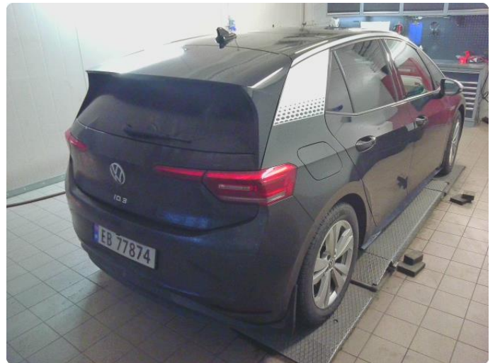
2.1 Div steinsprut og riper finnes