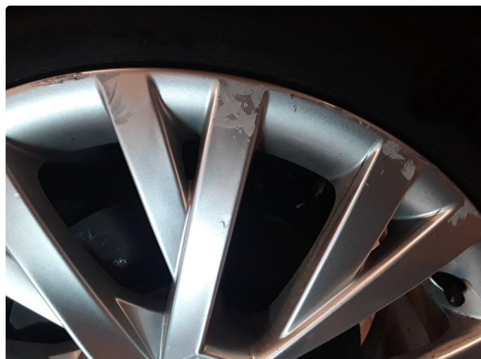
1.3 4 noe kantkjørte sommerfelger.