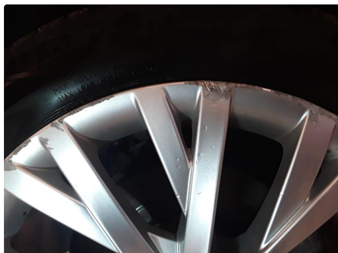
1.3 4 noe kantkjørte sommerfelger.