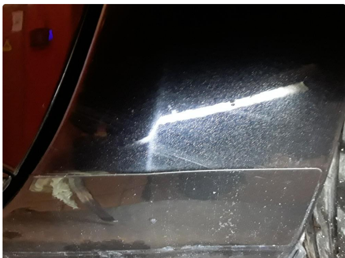
1.2 Steinsprut med korrosjon.