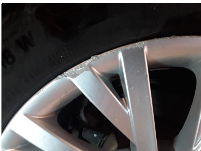
1.3 4 noe kantkjørte sommerfelger.