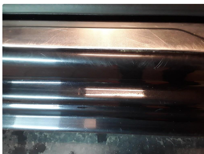
1.4 Noe riper venstre foran.