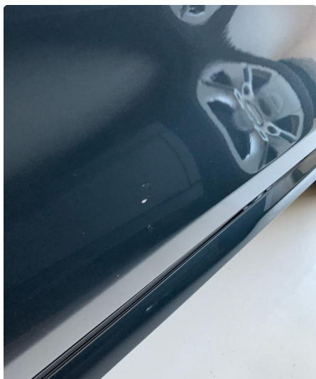
1.2 Noe lakksår på venstre bakdør. Blir penslet.