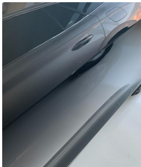
1.2 Noe lakksår på venstre bakdør. Blir penslet.