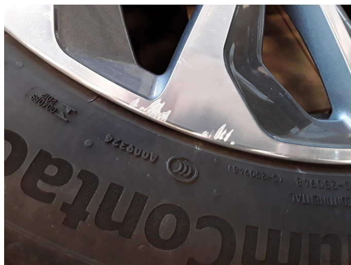
1.3 2 noe kantkjørte sommerfelger.