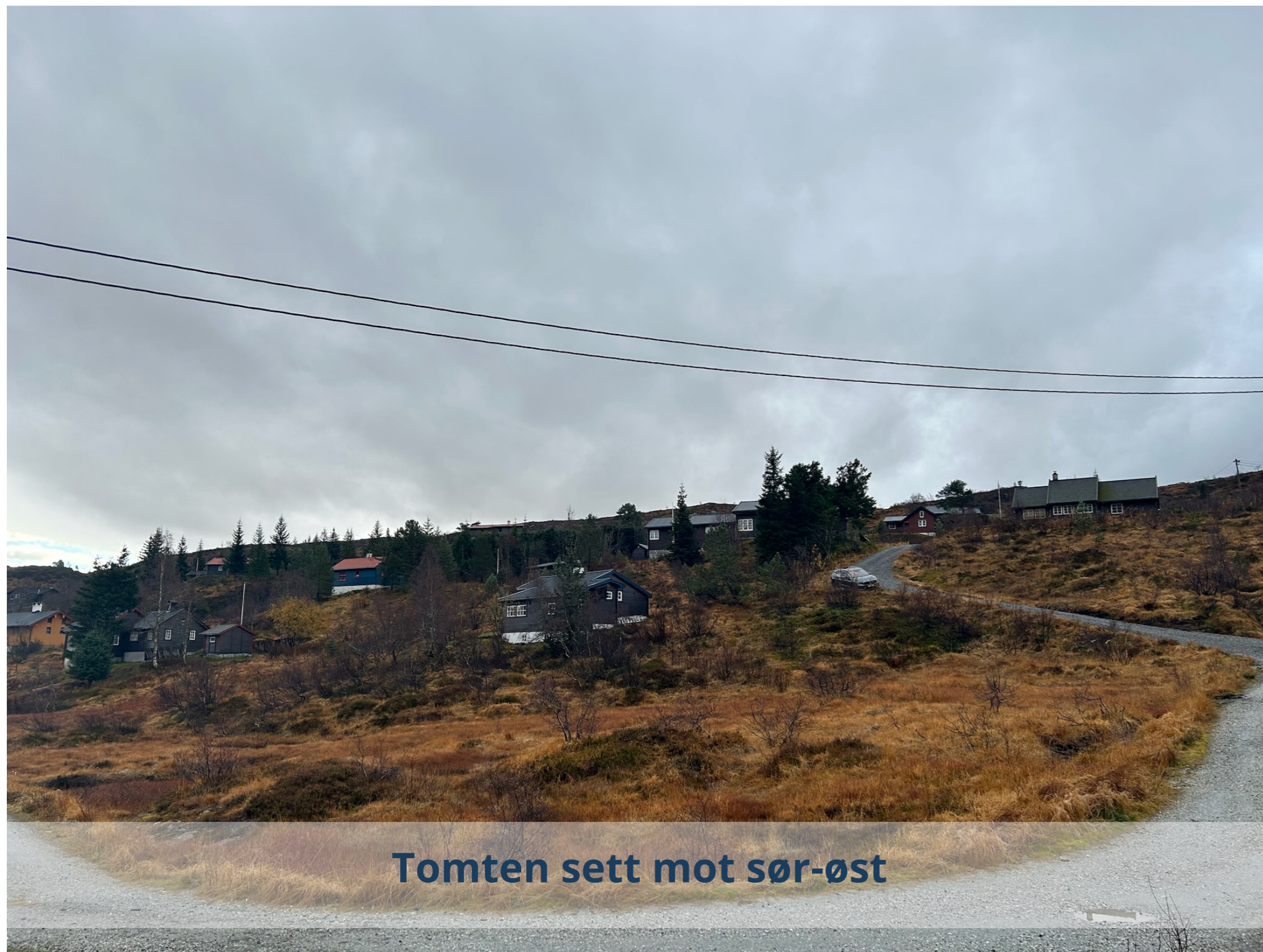
Tomten sett mot sør-øst