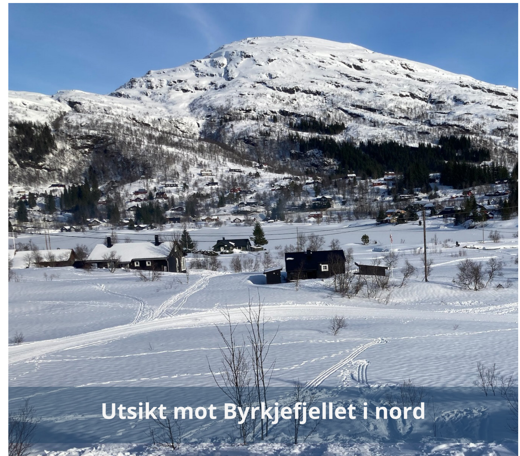
Utsikt mot Byrkjefjellet i nord