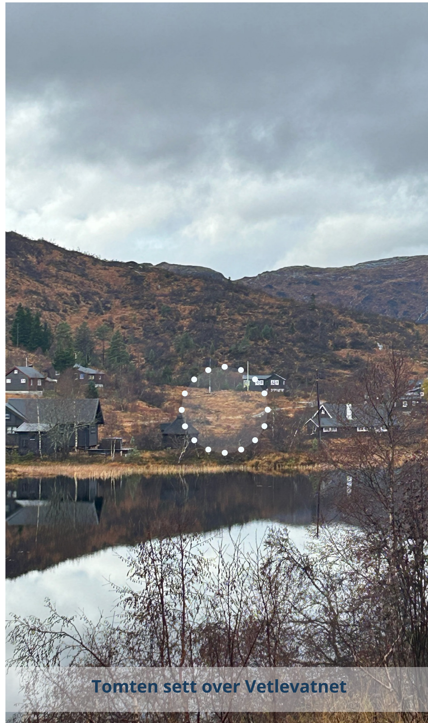
Tomten sett over Vetlevatnet