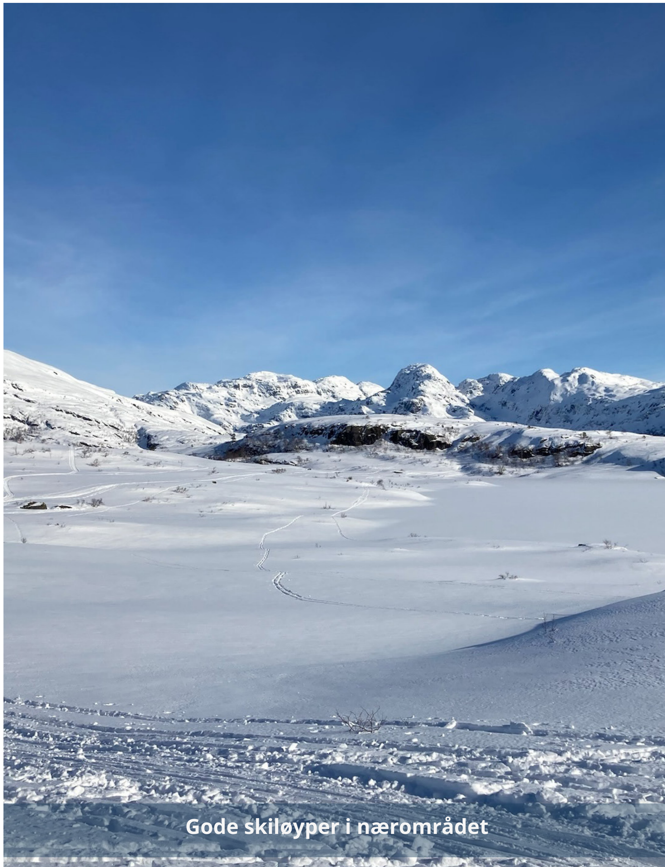
Gode skiløyper i nærområdet