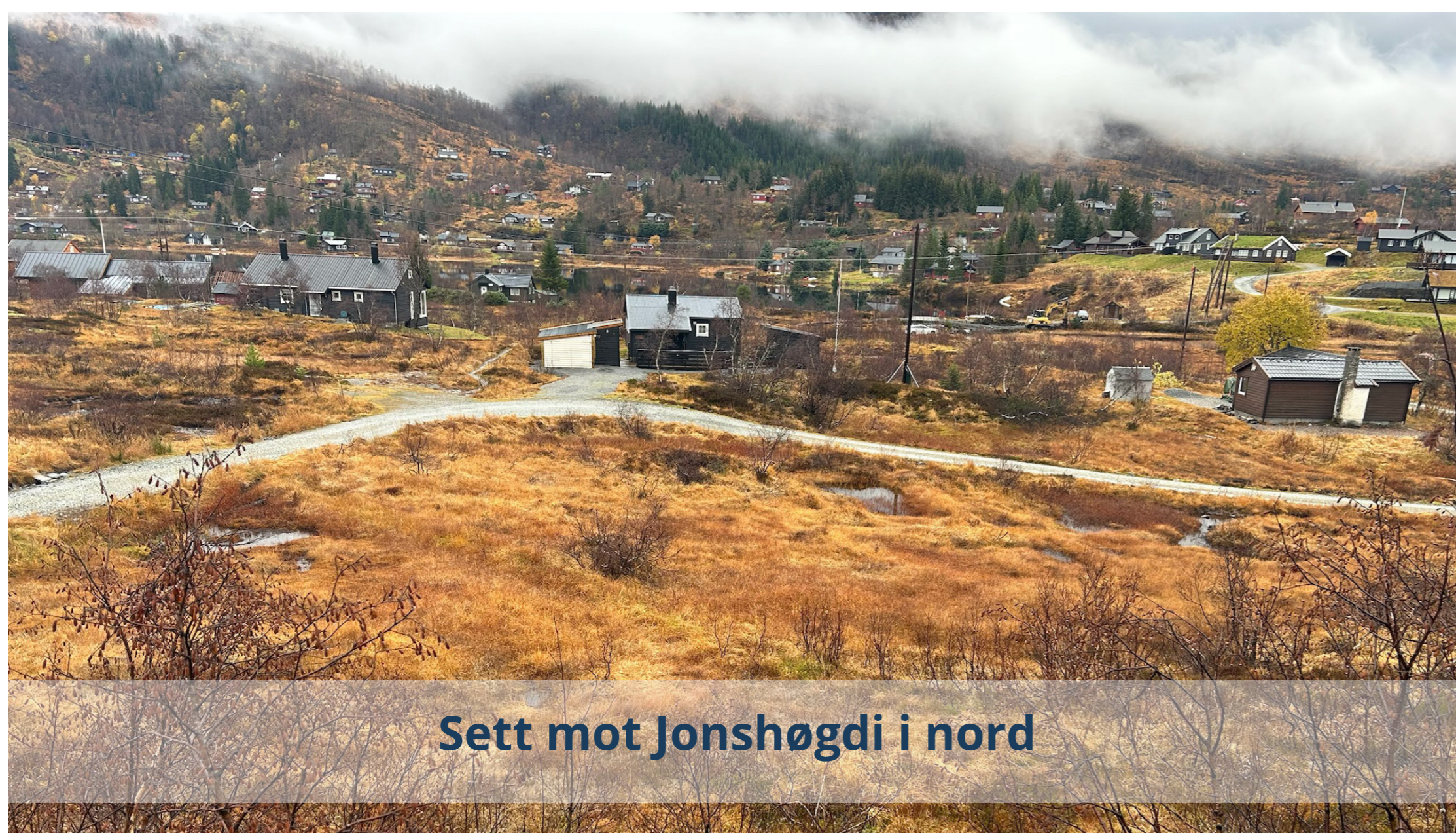
Sett mot Jonshøgdi i nord