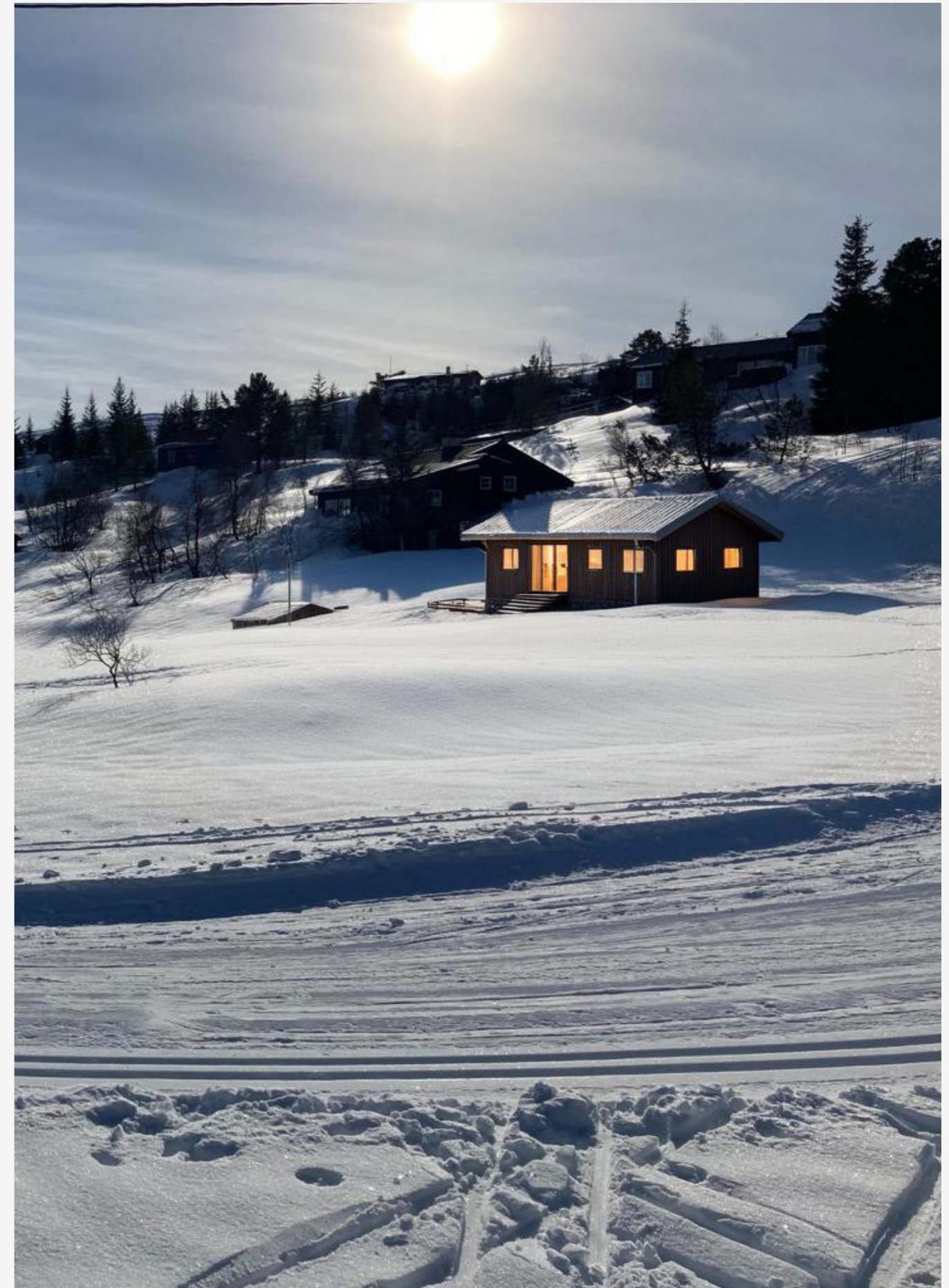
Illustrasjoner produsert med AI