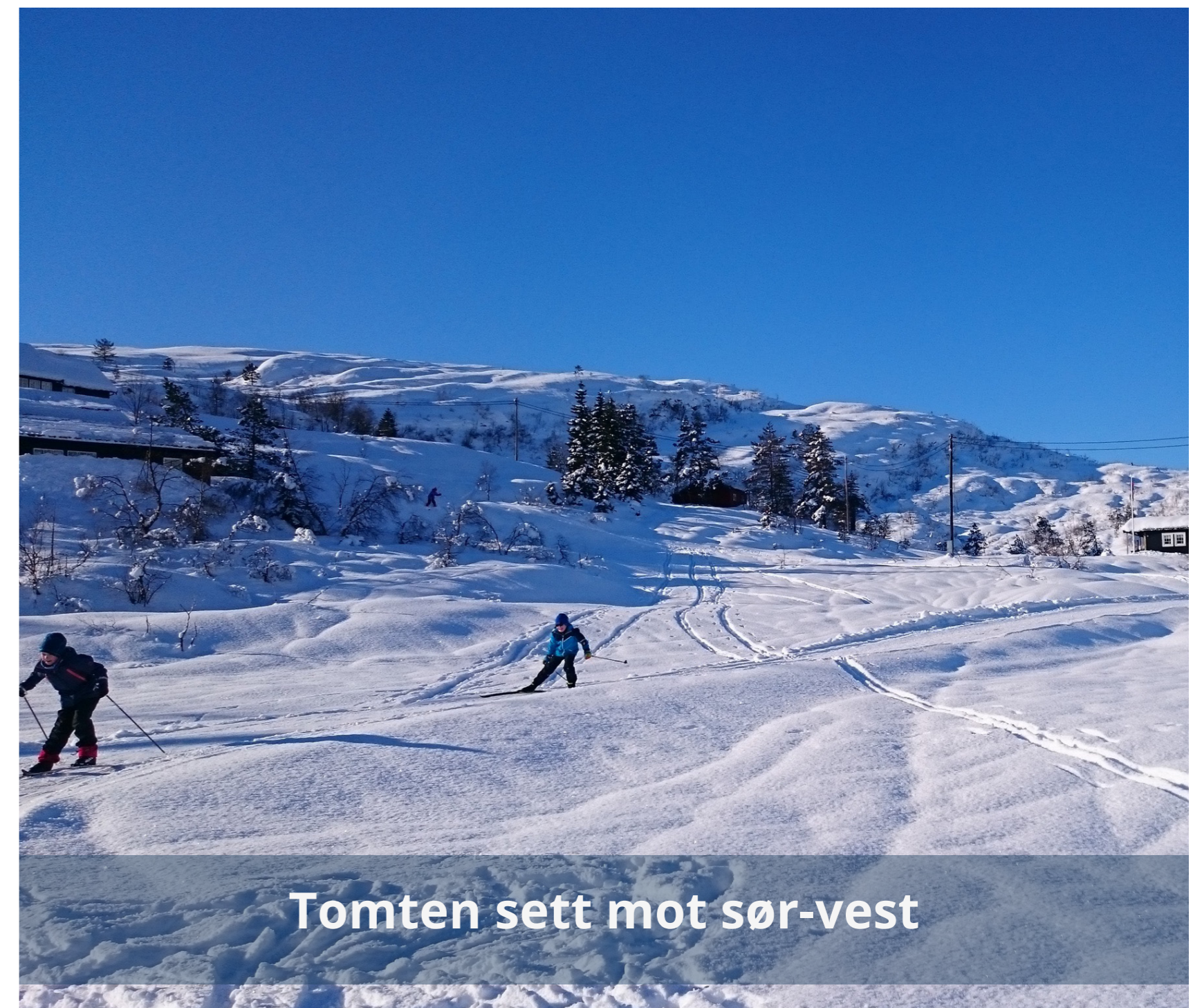
Tomten sett mot sør-vest