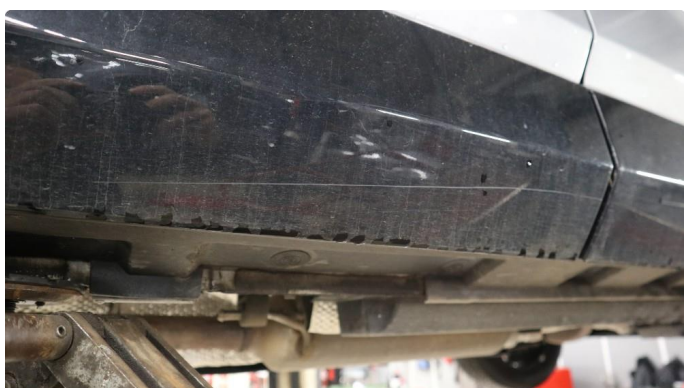
1.1 Øvrige feil