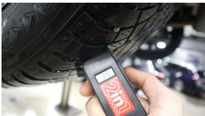
1.3 For lite mønsterdybde vinterdekk 2 stk