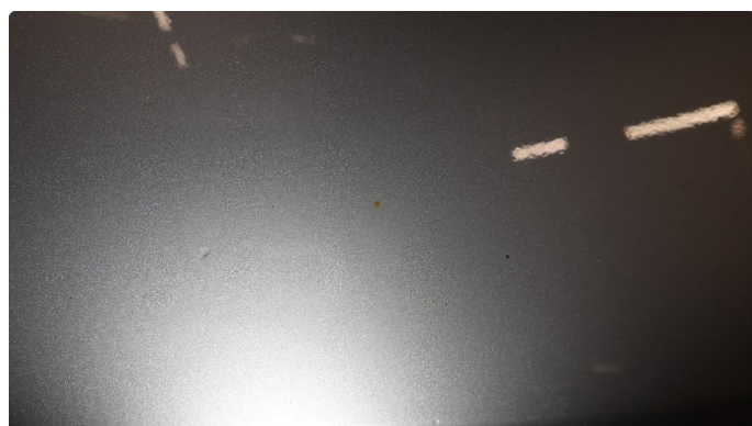
1.1 Øvrige feil