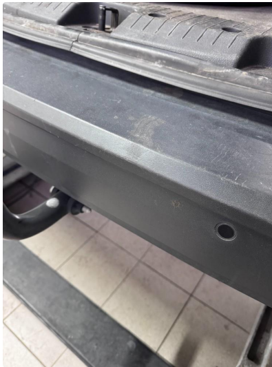
1.2 Noen riper.