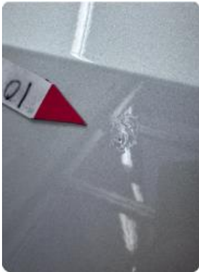
1.1 Steinsprut med korrosjon.