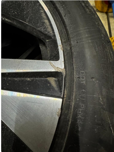
1.1 Liten skade på en felg