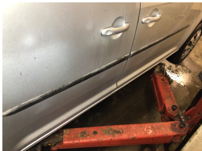
1.1 Løse/skadede lister