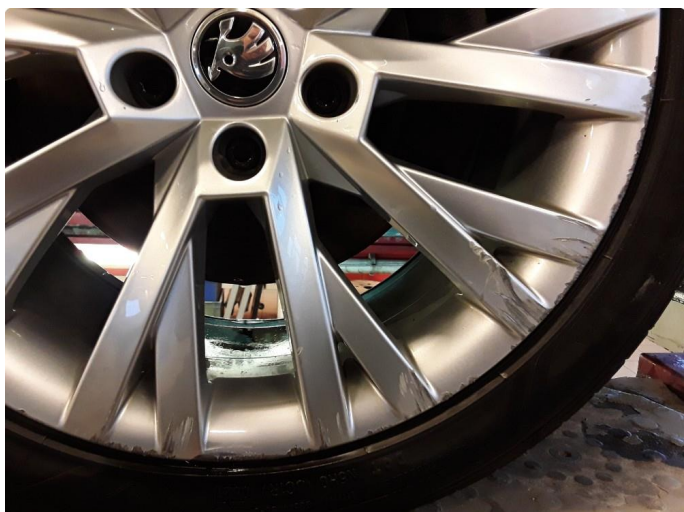
1.2 Kantkjørt felg