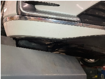
1. Lakk / karosseri utvendig