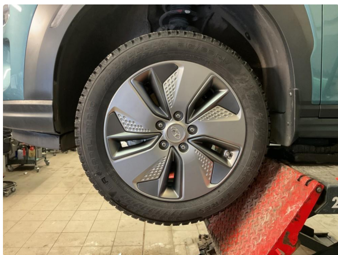
1.2 Øvrige feil