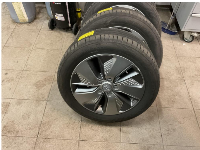
1.1 Noen riper på 2 av sommerfelgene