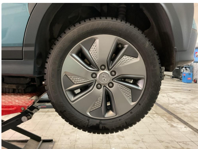
1.2 Øvrige feil