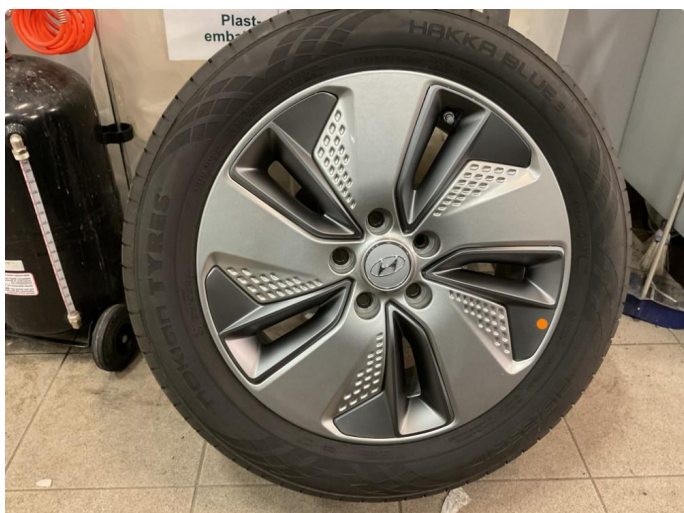
1.1 Noen riper på 2 av sommerfelgene