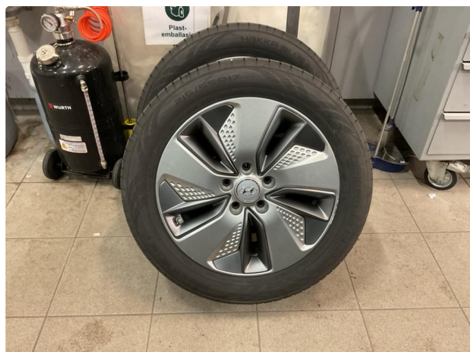
1.1 Noen riper på 2 av sommerfelgene