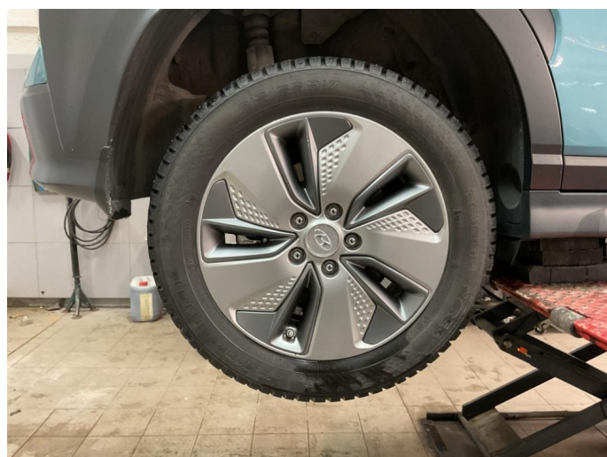
1.2 Øvrige feil