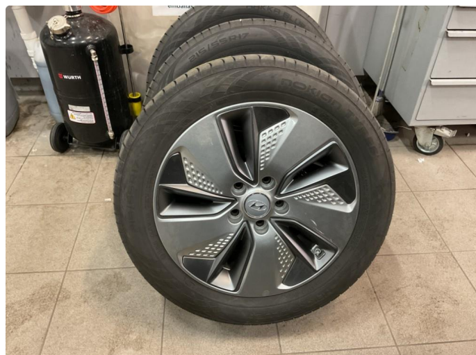
1.1 Noen riper på 2 av sommerfelgene