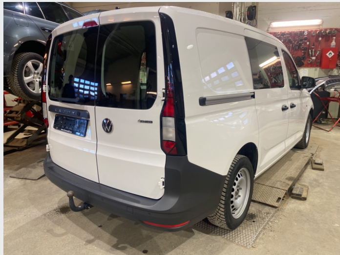
2.1 Oversiktsbilder av bilen