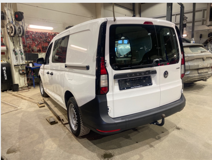
2.1 Oversiktsbilder av bilen