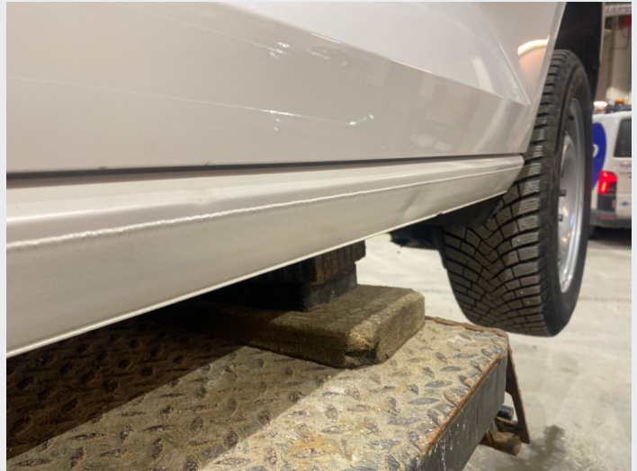
2.4 Bulket kanal venstre side