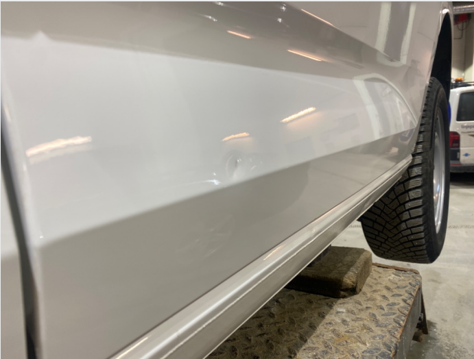
2.5 Liten bulk venstre skyvedør