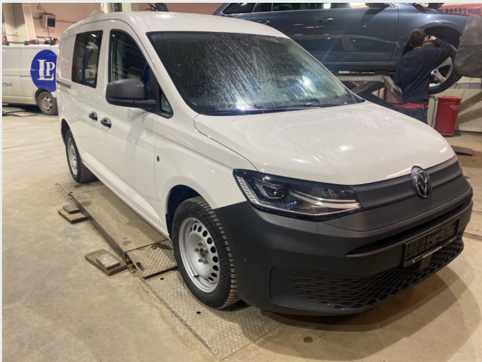
2.1 Oversiktsbilder av bilen