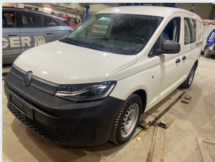
2.1 Oversiktsbilder av bilen