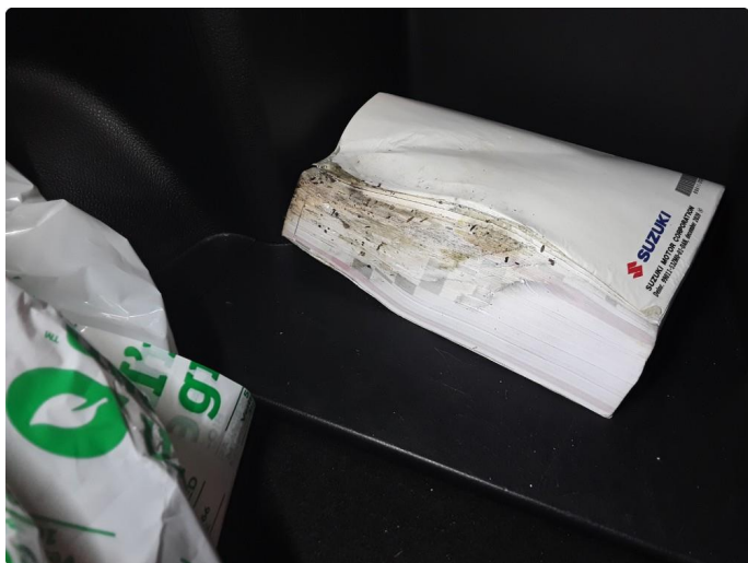
3.2 Stygg instruksjonsbok