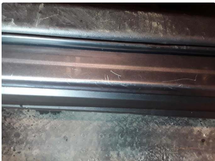
1.2 Noen riper og småbulker