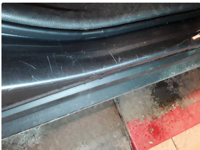
1.3 Bulk(er) med lakkskade