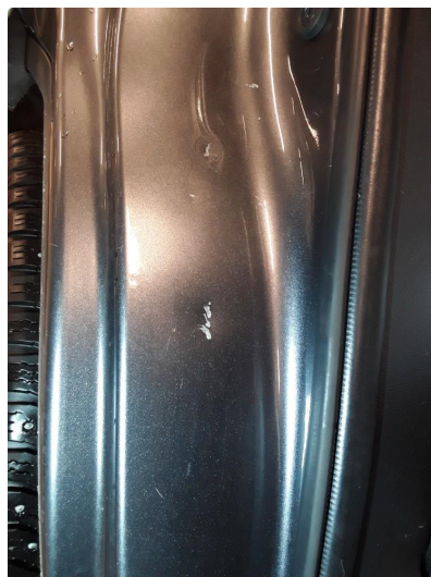
1.3 Bulk(er) med lakkskade