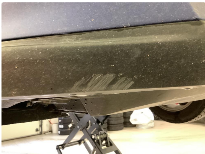
1.1 Ripe(r) Nede på Plast HF