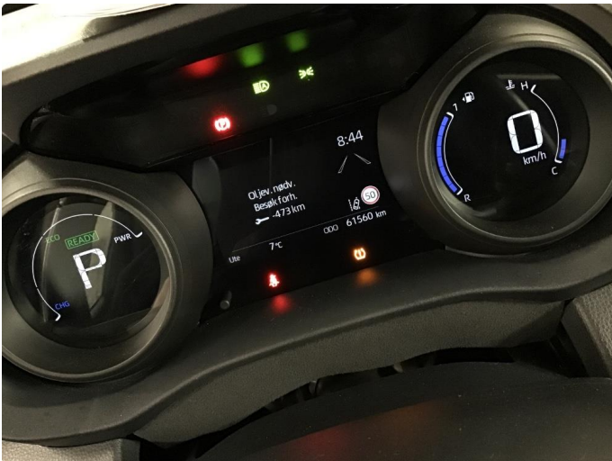
2.1 Trenger service