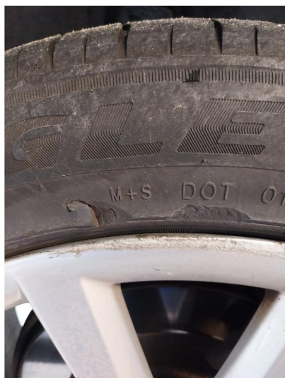
1.3 Dekkskade sommerhjul