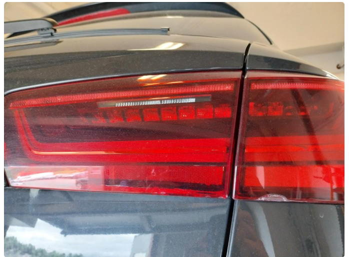
2.3 Krakelering i plast