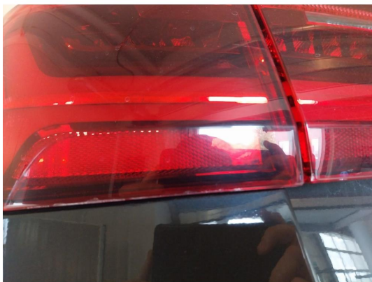
2.3 Krakelering i plast