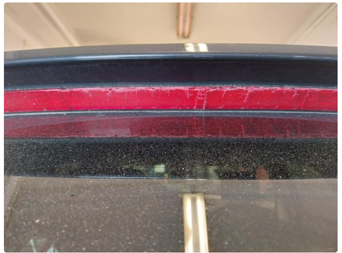
2.2 Defekt / sprukket glass