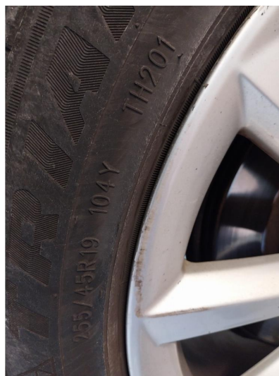
1.3 Dekkskade sommerhjul