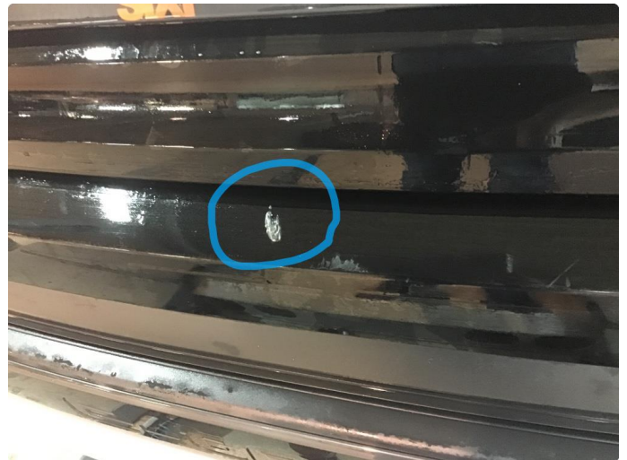
1.2 Øvrige feil