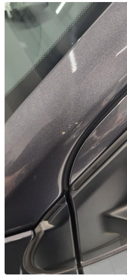
1.6 Ripe ned til grunning