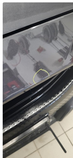
1.3 Øvrige feil