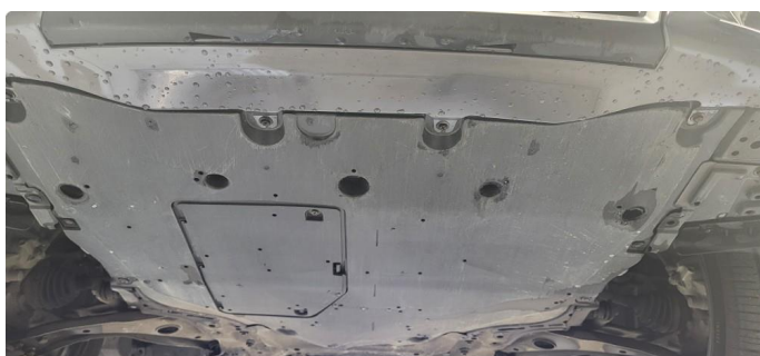
1.4 Skrubbskader underkant