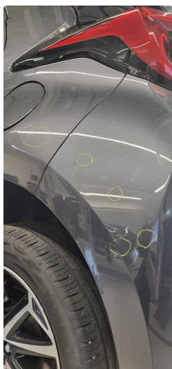
1.3 Øvrige feil