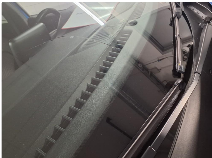
1.2 Ny frontrute