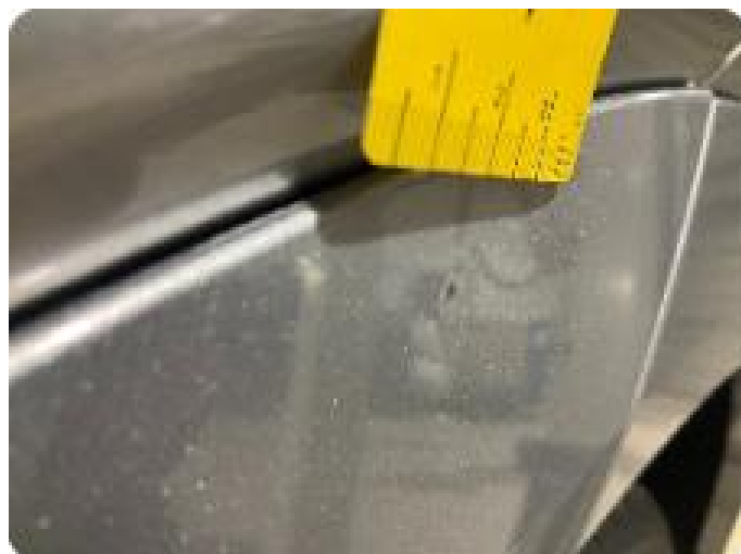
1.2 Liten bulk med lakkskade