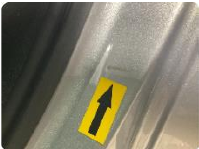
1.2 Liten bulk med lakkskade