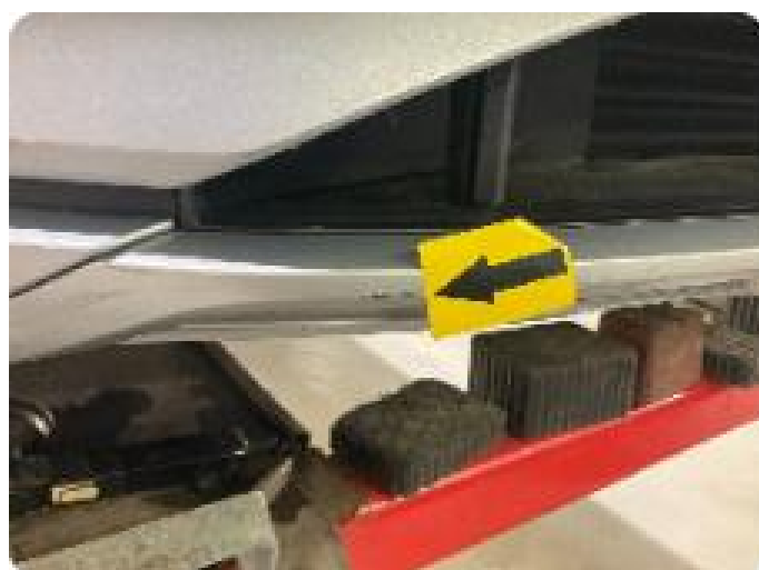
1.4 Ripe ned til grunning