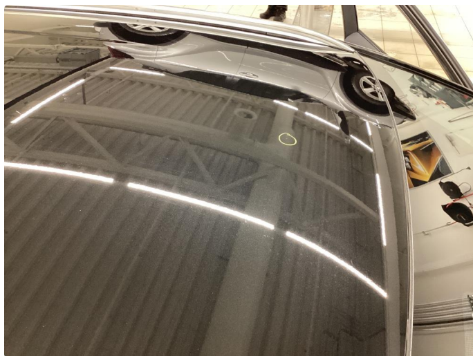
1.8 Steinsprut med rust