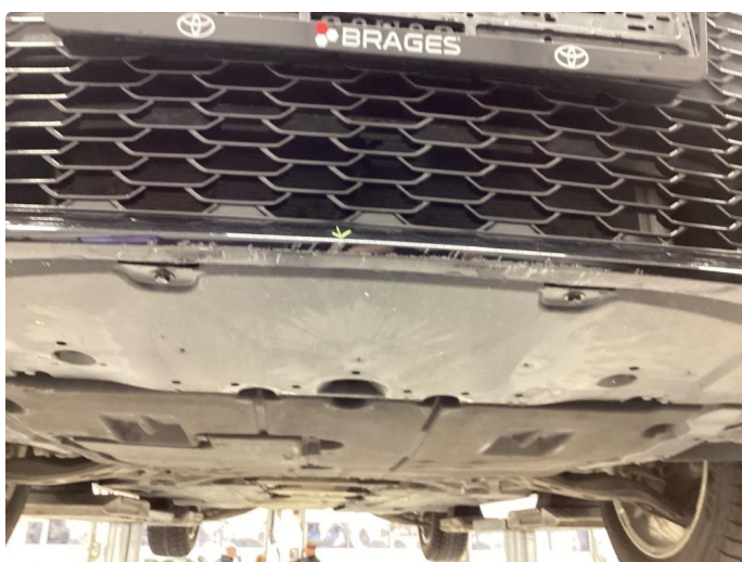
1.6 Skrubbsskader underkant