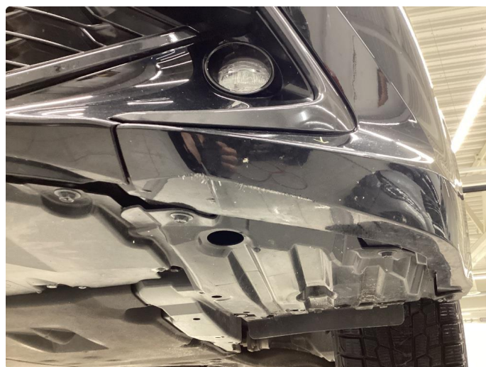
1.6 Skrubbsskader underkant