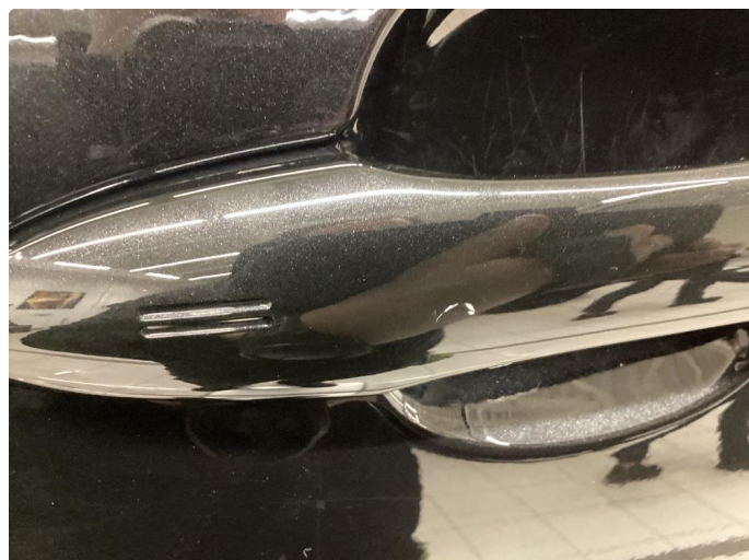
1.2 Håndtak lakskadet/flasser