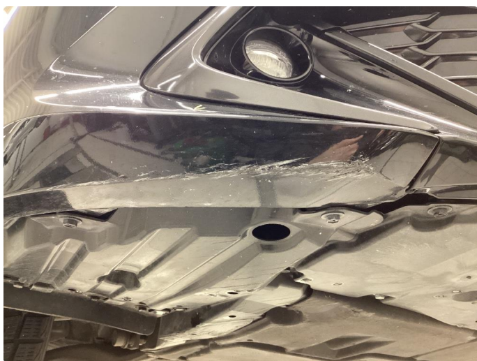
1.6 Skrubbsskader underkant