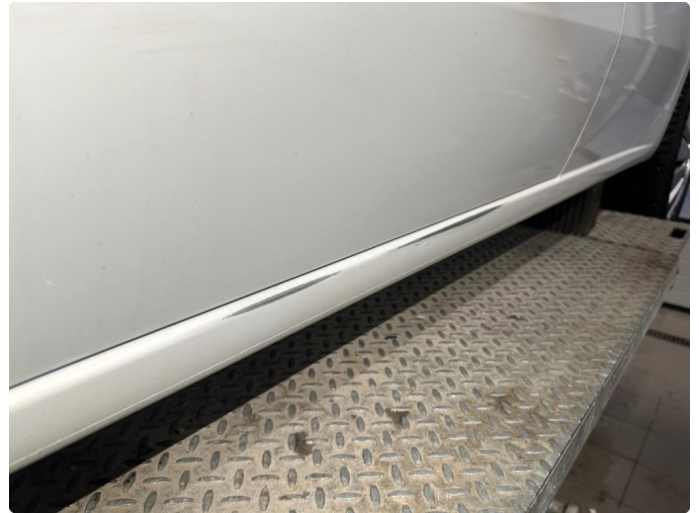
1.2 Litt lakk bortslitt fra døråpning