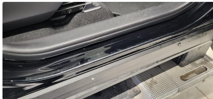
1.3 Noen riper og småbulker