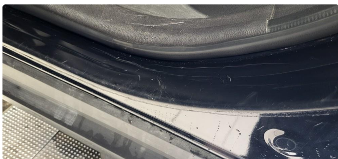
1.3 Noen riper og småbulker