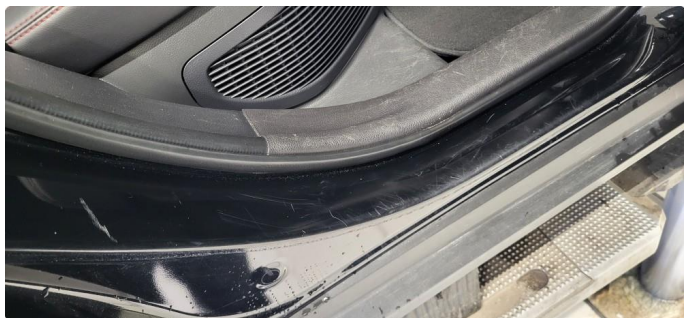
1.3 Noen riper og småbulker