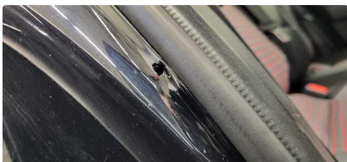
1.3 Noen riper og småbulker