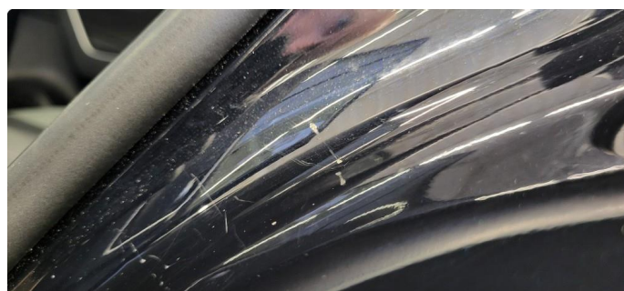
1.3 Noen riper og småbulker