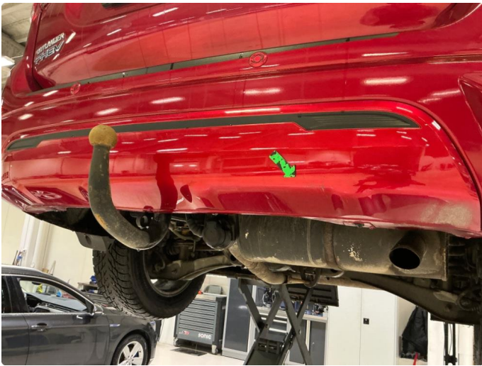
1.9 Riper nedre del fanger bak.