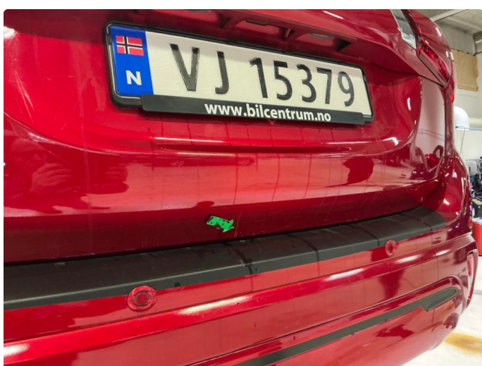
1.4 Riper nedre del bakluke.