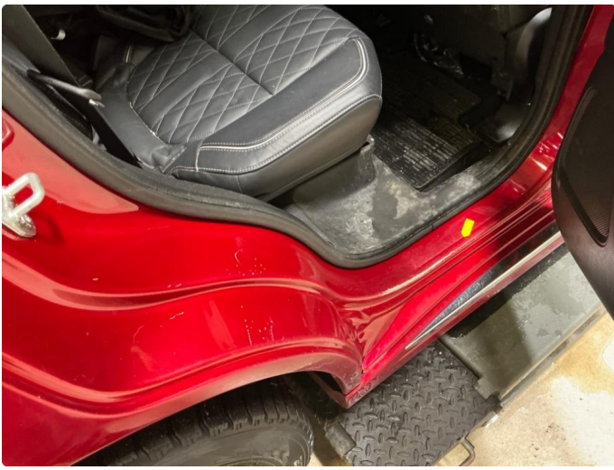
1.8 Slitte innsteg, alle