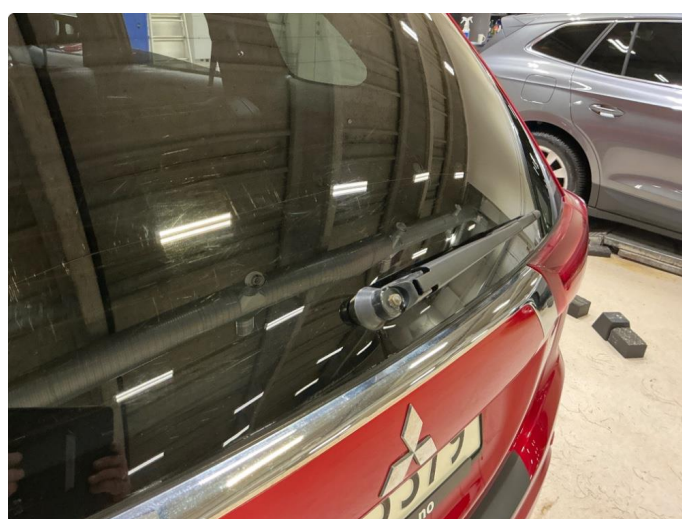
1.6 Mangler deksel spyler bak.