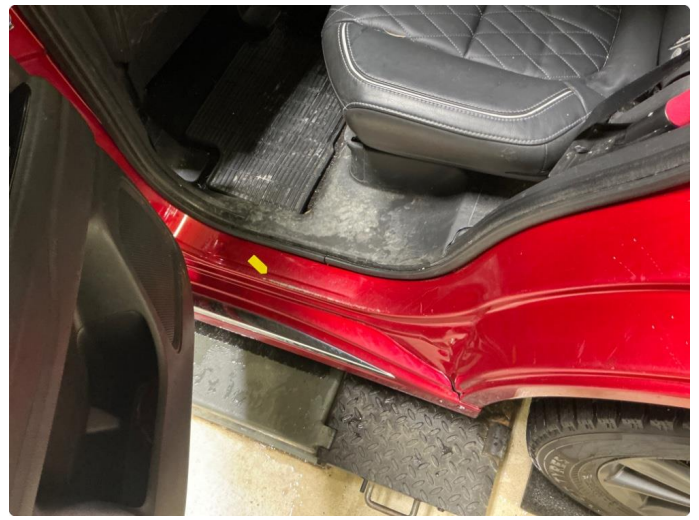
1.8 Slitte innsteg, alle