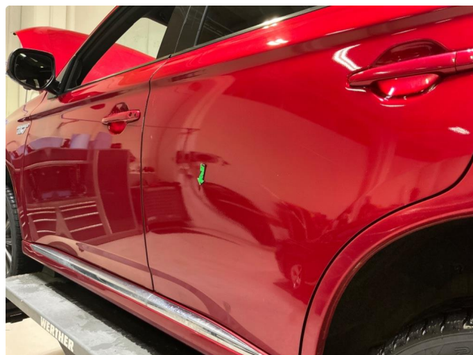
1.2 Liten bulk v.bd.