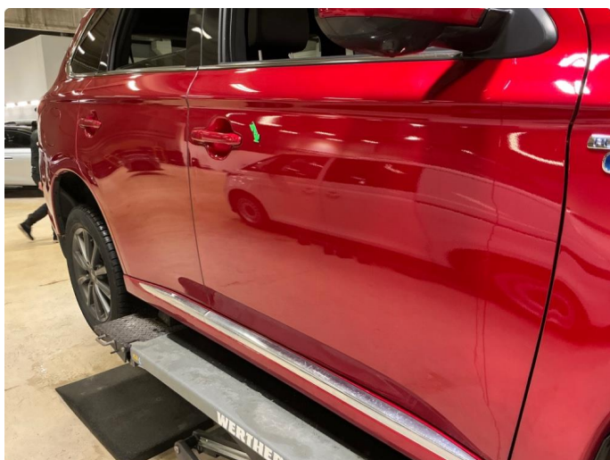
1.3 Liten bulk v.fd + h.fd.