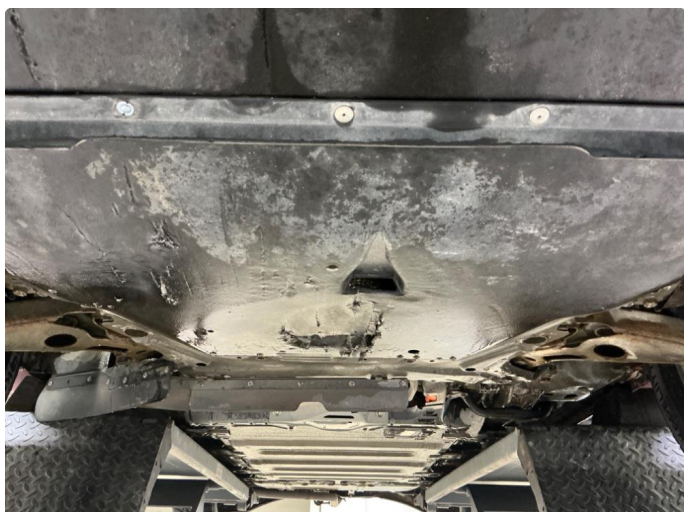
1.1 Plate under motor er skadet/sprekk