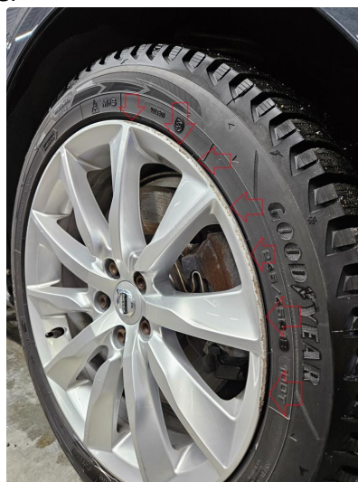
1.2 Noe skrubbermerker på ytre kant av 2 alu vinterfelger