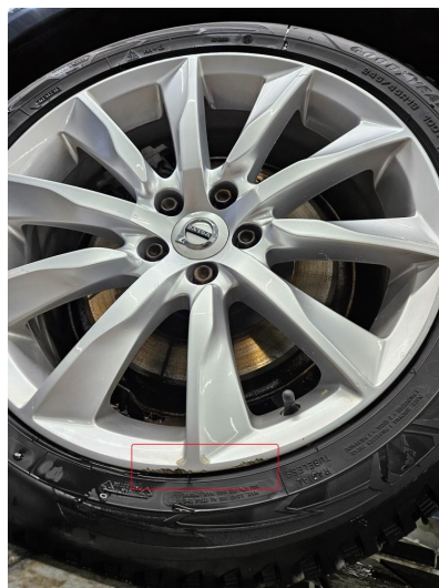
1.2 Noe skrubbermerker på ytre kant av 2 alu vinterfelger