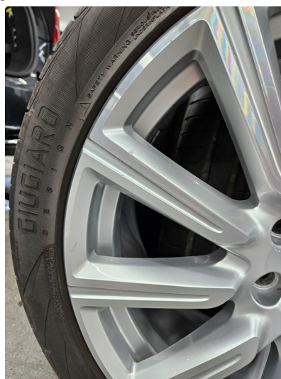
1.3 Små riper/sår på alu sommerfelger