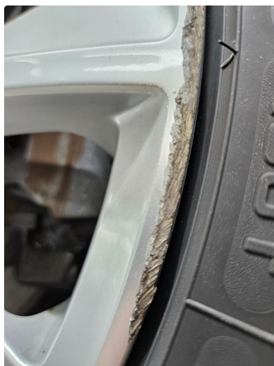
1.2 Noe skrubbermerker på ytre kant av 2 alu vinterfelger