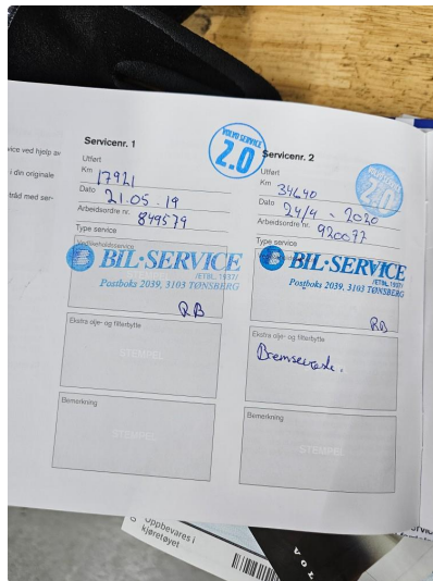
3.1 Dokumentert service, se bilde