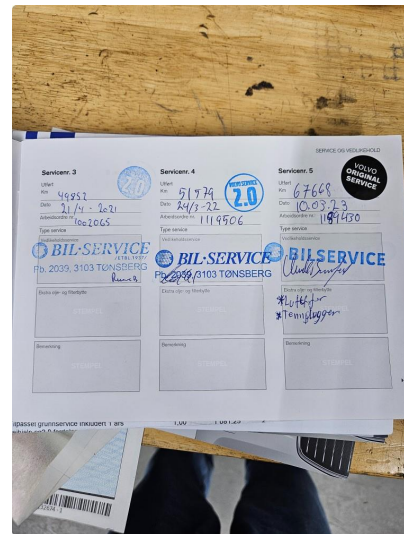
3.1 Dokumentert service, se bilde