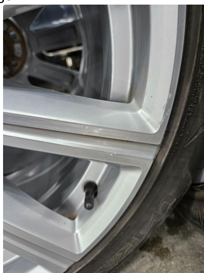
1.3 Små riper/sår på alu sommerfelger