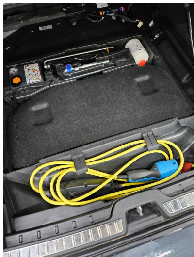
1.1 Dekktemiddel skiftet pga alder