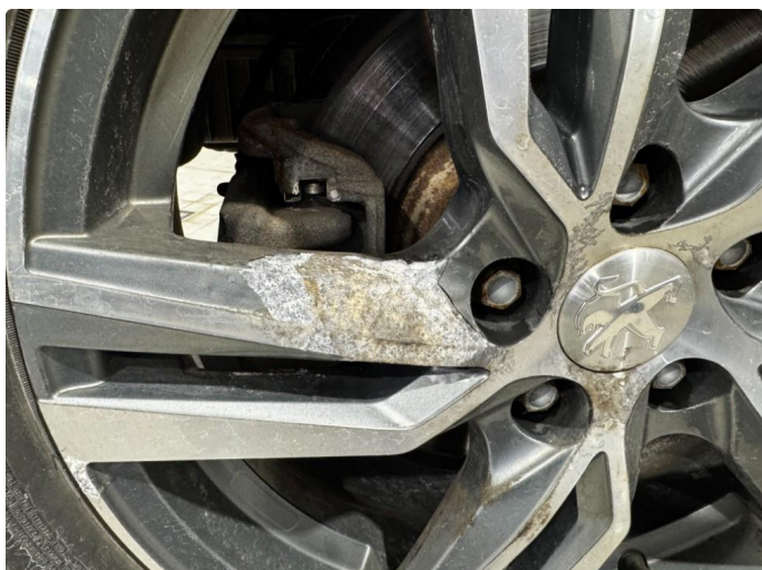
1.1 Lakk slipp på 3 vinterfelger