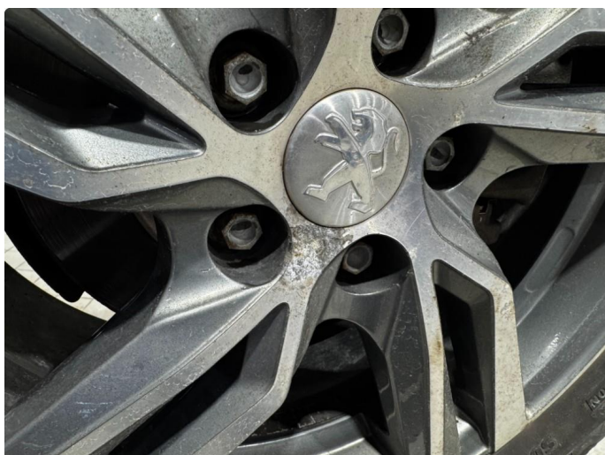
1.1 Lakk slipp på 3 vinterfelger