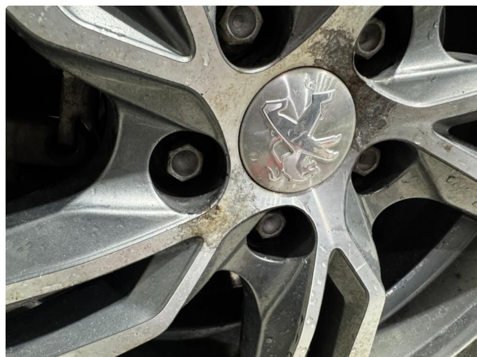
1.1 Lakk slipp på 3 vinterfelger