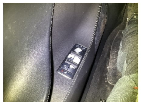
48. Ladekontakt elbil/hybrid