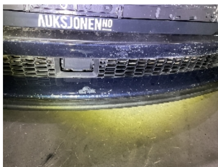
35. Støtfanger foran