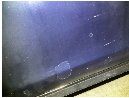
38. Venstre fordør