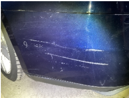
40. Støtfanger bak