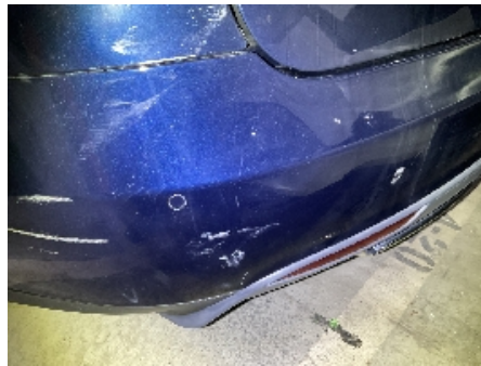
41. Støtfanger bak