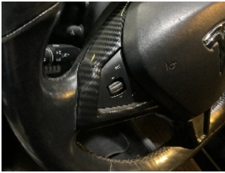
49. Dashbord / midtkonsoll