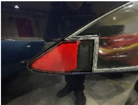
16. Ladekontakt elbil/hybrid