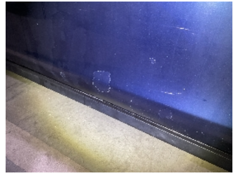
39. Venstre fordør