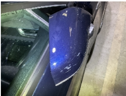
43. Høyre speil