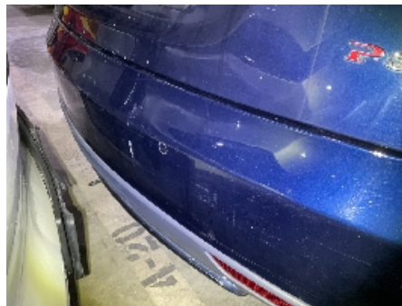
44. Støtfanger bak