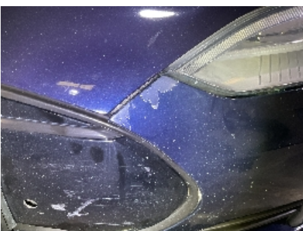
34. Støtfanger foran