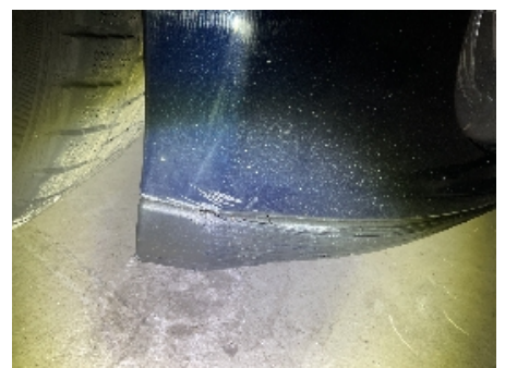
36. Støtfanger foran