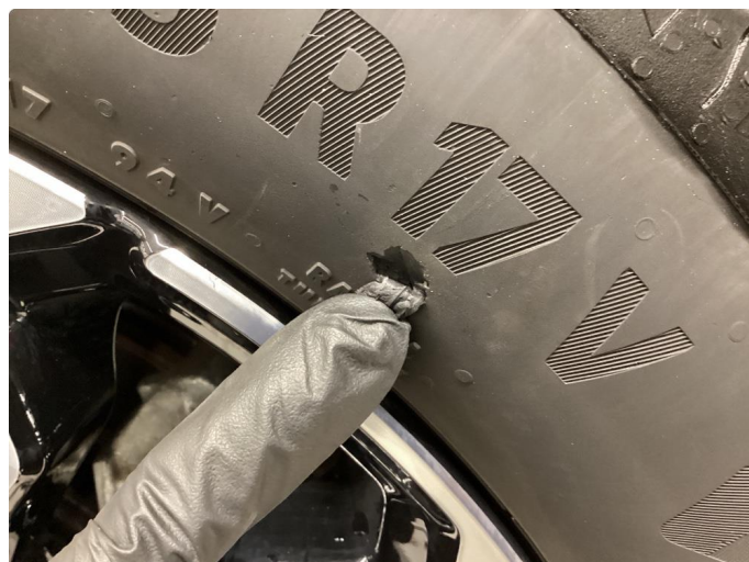
1.2 Dekkskade sommerhjul