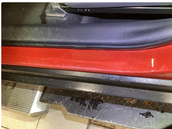
1.3 Slitt innsteg