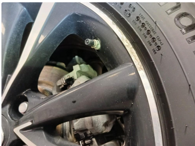
1.1 Slitasje venstre bakfelg (Vlnter)