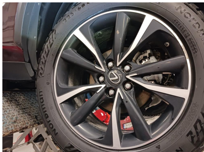
1.1 Slitasje venstre bakfelg (Vlnter)