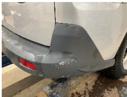
5. Lakk / karosseri utvendig