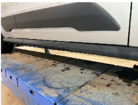
4. Lakk / karosseri utvendig