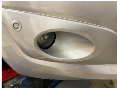
2. Lakk / karosseri utvendig