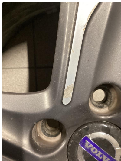
1.2 Oppskrapet felg, normalt ihht alder og km