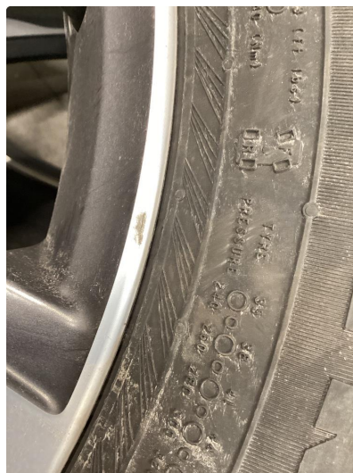
1.2 Oppskrapet felg, normalt ihht alder og km