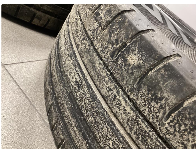
1.3 4 sommerdekk byttes og sette på nytt