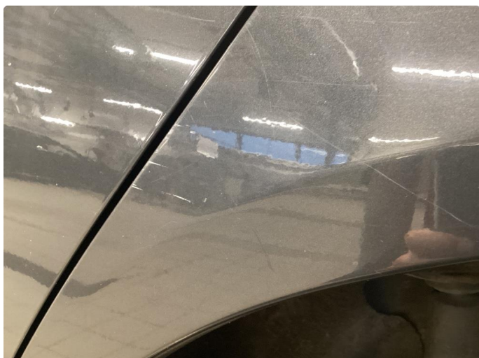
1.1 Ripe(r) Normalt ihht alder og km