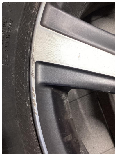
1.2 Oppskrapet felg, normalt ihht alder og km