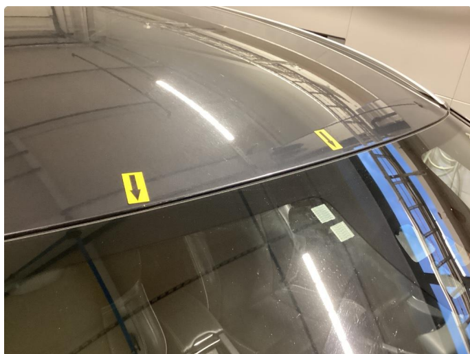
1.6 Steinsprut med rustflekker, normalt ihht alder og km