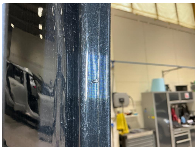
1.3 Påbegynnende korrosjon dør høyre foran