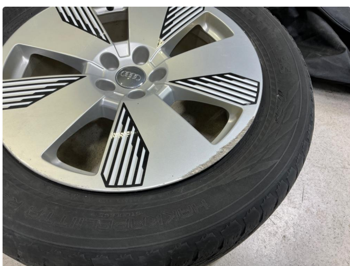
1.4 Kantkjørt felg vinter