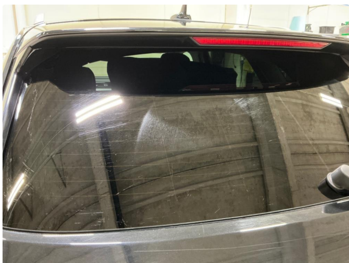
1.7 Slitt bakvindu