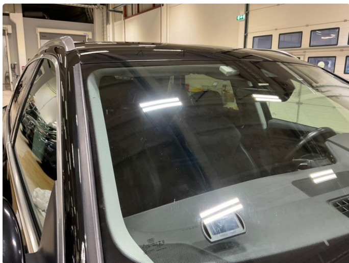
1.6 Frontvindu slitt