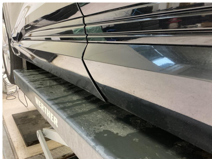
1.2 Nedre sidelist løs