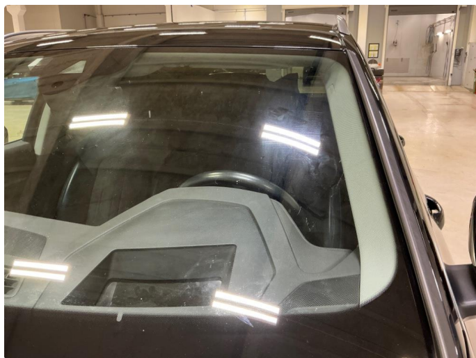
1.6 Frontvindu slitt