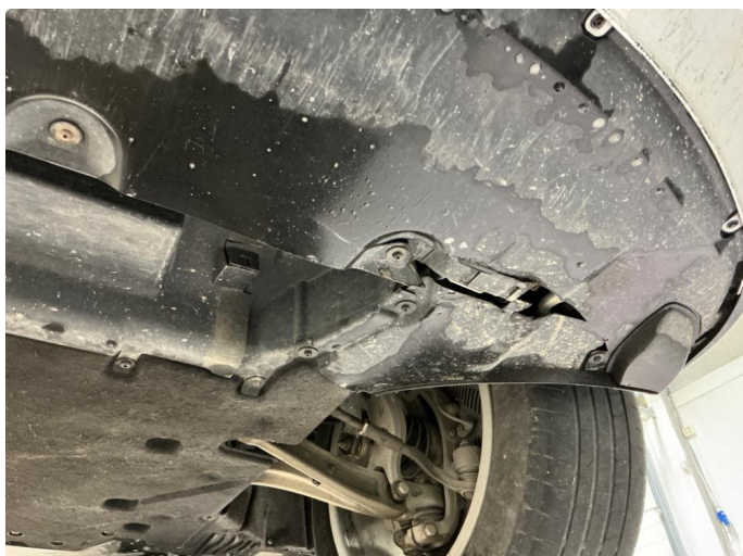
1.1 Beskyttelsesplate skadet