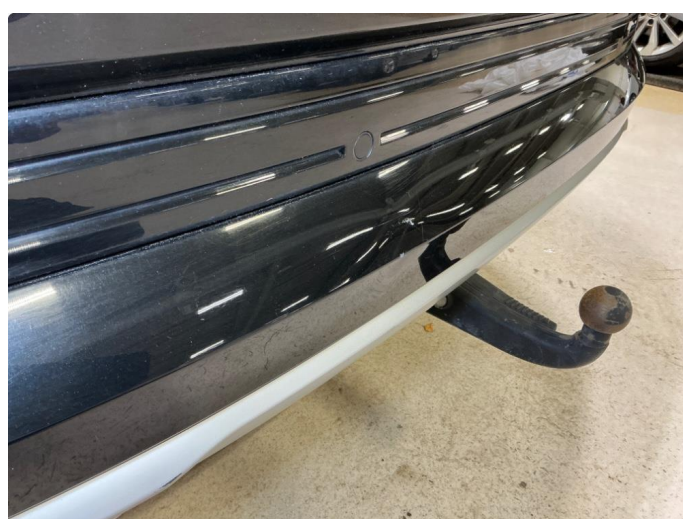
1.5 Bakfanger bulk