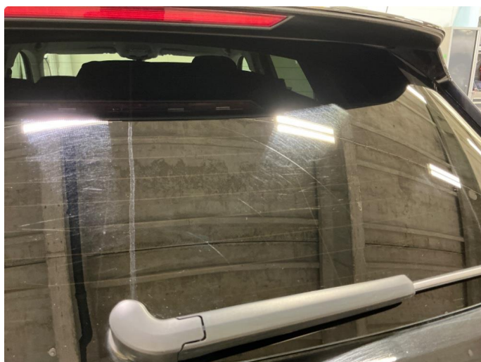
1.7 Slitt bakvindu