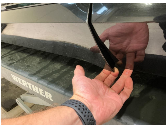
1.2 Nedre sidelist løs