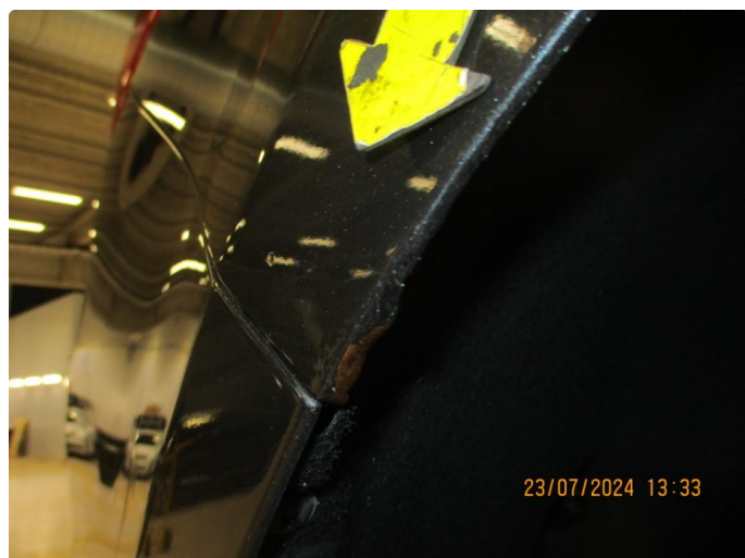
1.3 Rustblærer h.bakskjerm