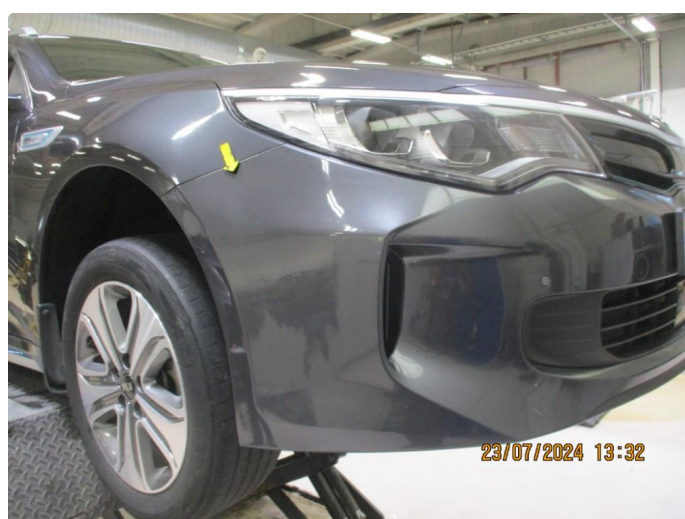
1.5 Ser ut som det er utført en smartrepair h.fangerhjørne foran