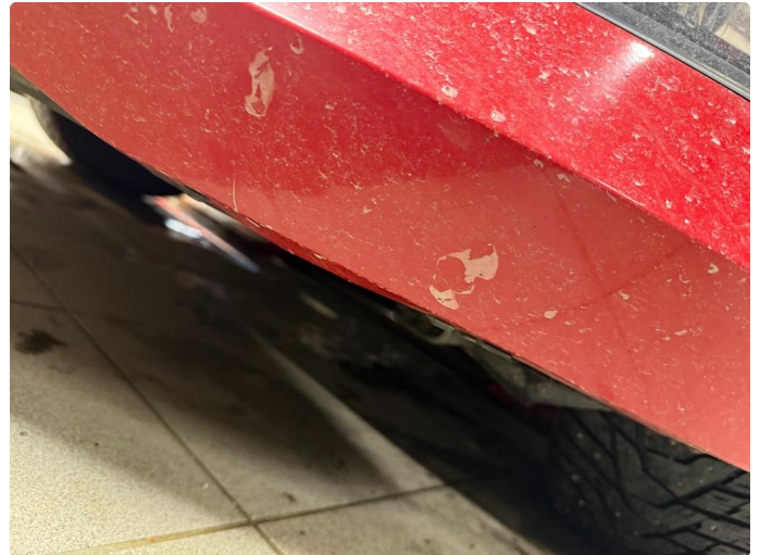
1.1 Lakk flasser