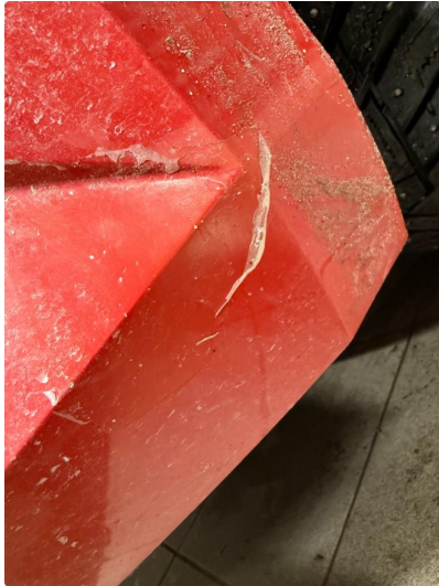
1.1 Lakk flasser