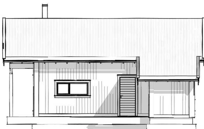
Sør 1 : 100