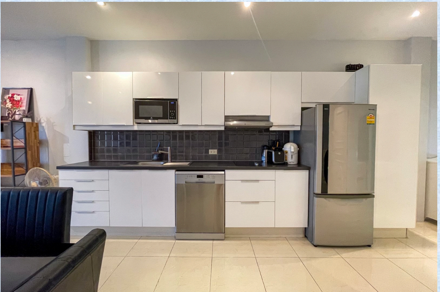
En fullt ut møblert og utrustet leilighet klar til innflytning.