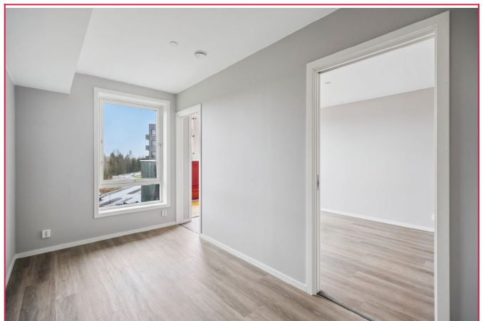
Soverom med 2 innganger