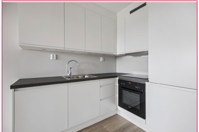
Kjøkken med integrerte hvitevarer