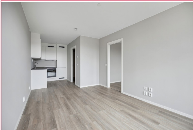
Åpen stue og kjøkkenløsning