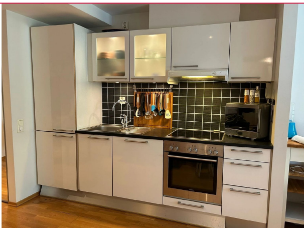
Kjøkkenet med god skapsplass, integrerte hvitevarer.