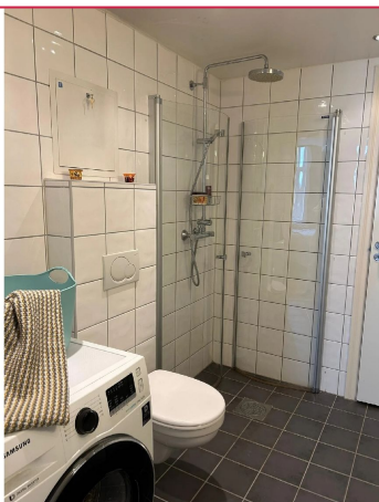
Helfiset badrom utstyrt med dusj, wc og kombinert vaskemaskin og tørketrommel.