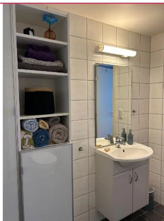
Baderom utstyrt med servant m/speil, samt skap for oppbevaring.