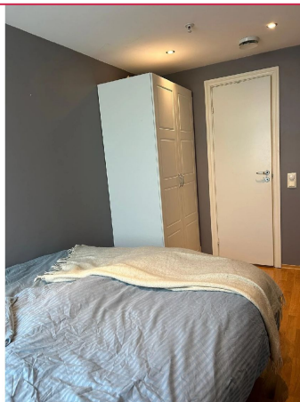
Plass til garderobeskap, godt med oppbevaringsmuligheter.