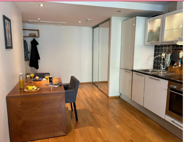
Innebygget garderobeskap med god oppbevaring, spisegruppe på kjøkkenet.