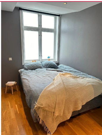
Soverom i mørke farger av god størrelse.