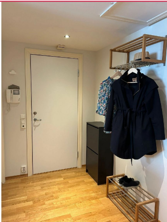
Lyst inngangsparti med god plass til å henge fra seg ytterklær.