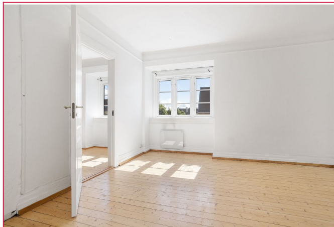
soverom 2, 1. etg.