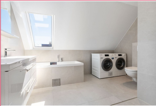
bad 2. etg.