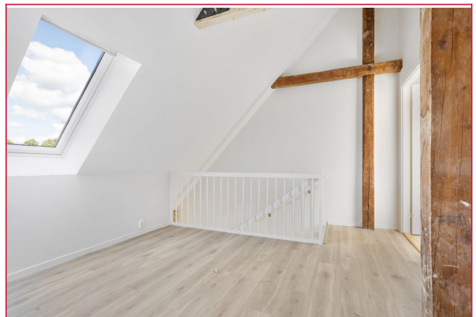
oppholdsrom i 2. etg.