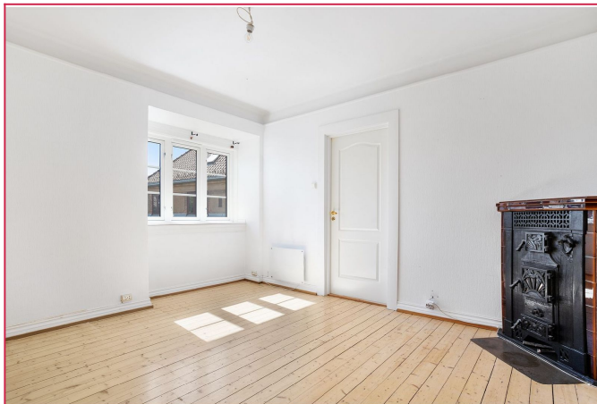
soverom 1, 1. etg.