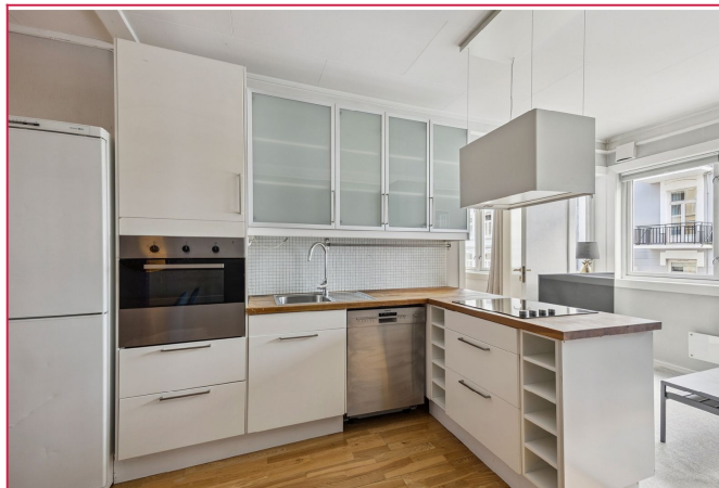
Stort kjøkken med rikelig med arbeids og benkeplass.