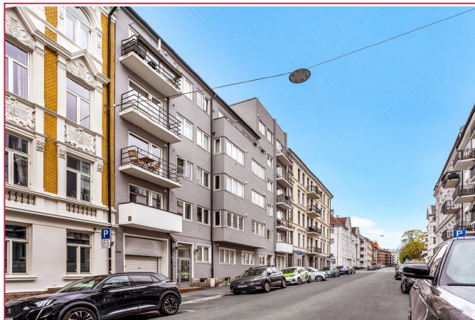
Fasade Erling Skjalgssons gate 22 A