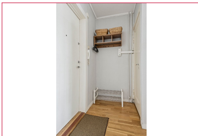
Entré med garderobeplass.