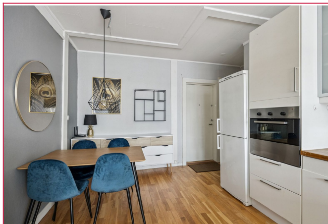
Leiligheten leies ut med møblene vist.