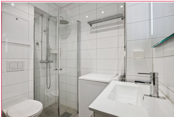
Lekker flislagt badrom med vaskemaskin.