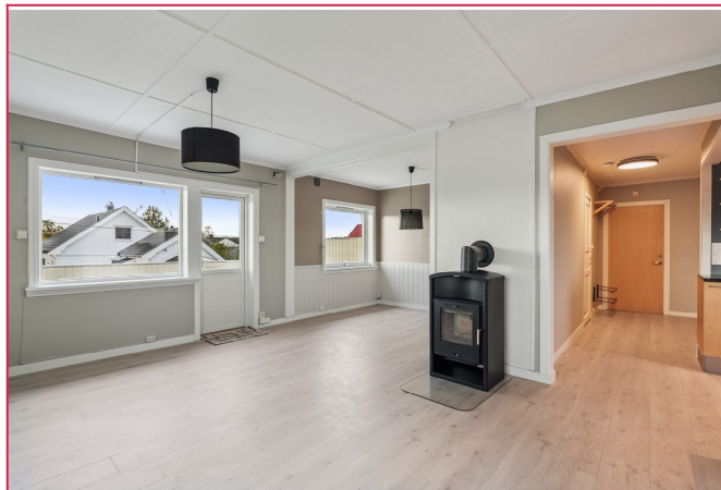
Stue med peisovn