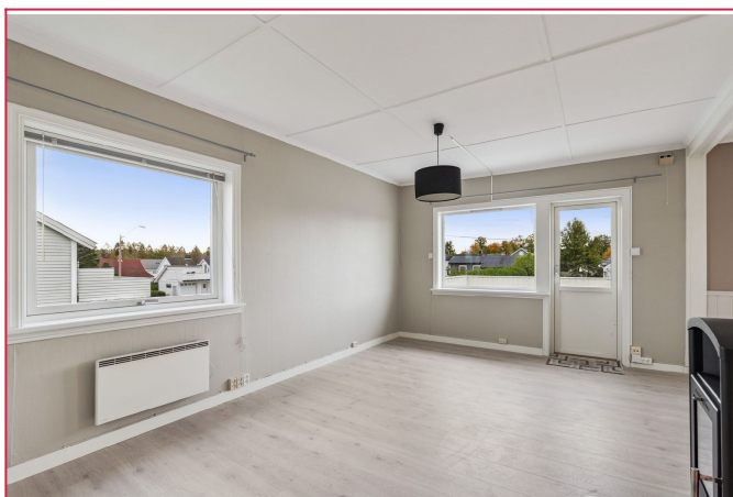
Lys og fin stue