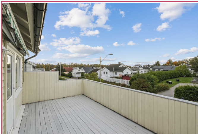
Stor og flott balkong!