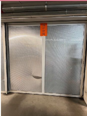
Plass nr. 70