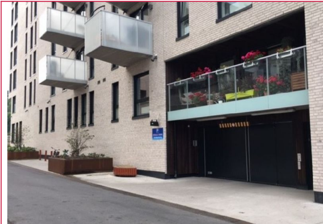
Inngang til garasjeanlegg