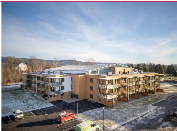
Velkommen til Bovieran!