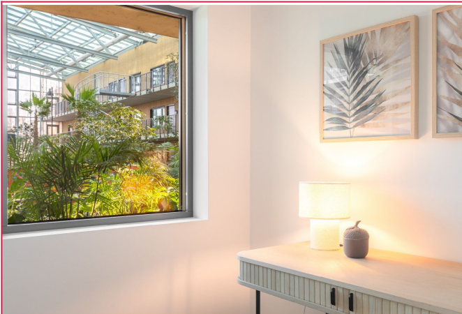
Soverom nr. 2