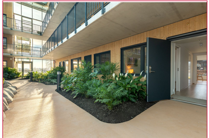
Nydelige fellesområder rett utenfor døren