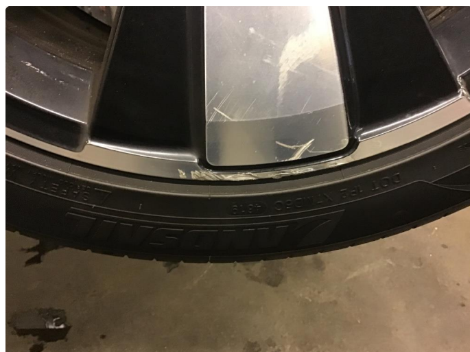
1.4 Kantkjørt felg