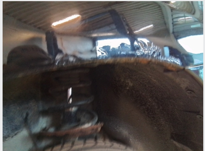
2.7 Rust høyre bakskjerm