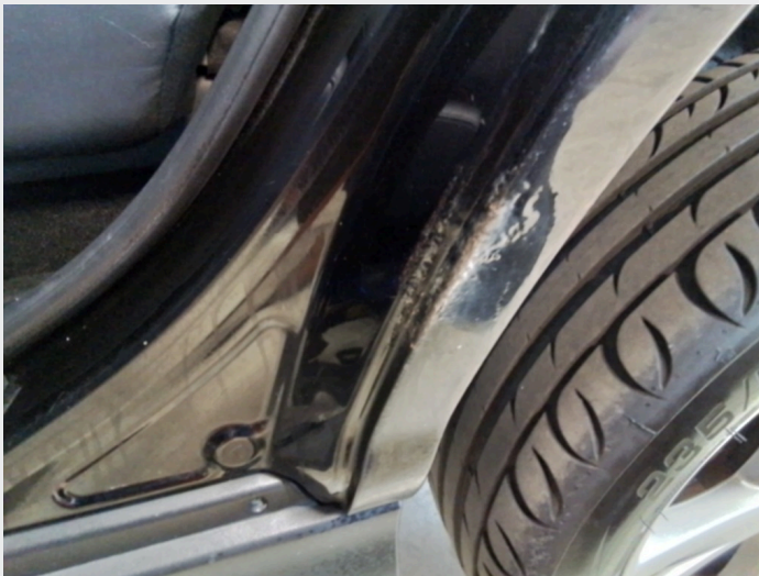
2.7 Rust høyre bakskjerm