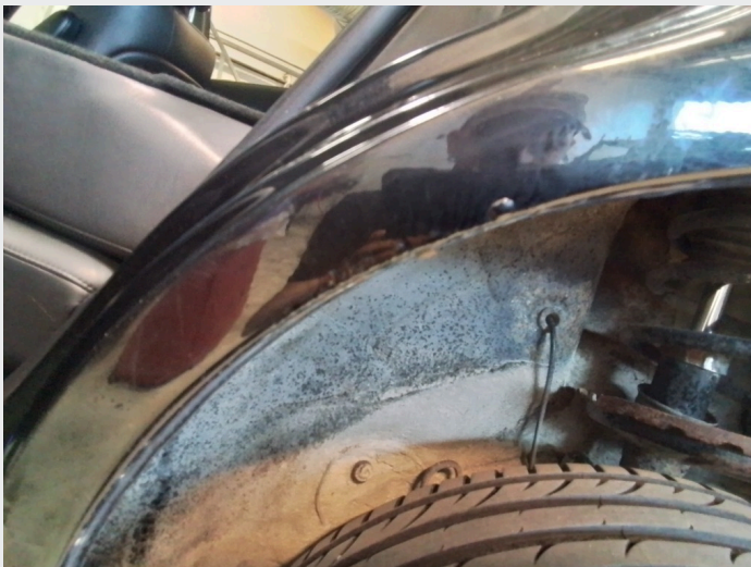
2.7 Rust høyre bakskjerm