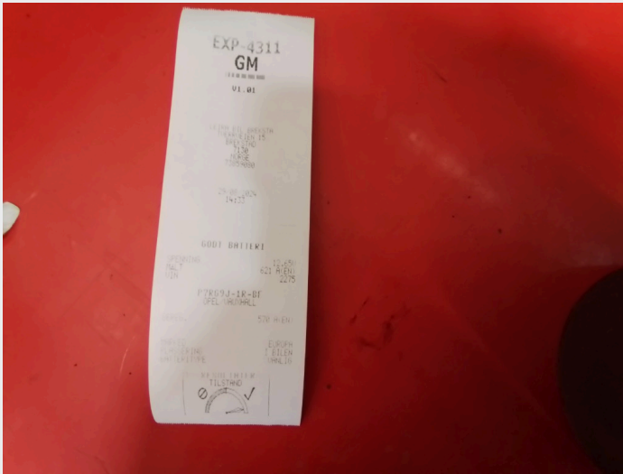
5.2 Godt batteri