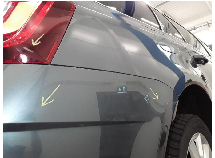
1.2 Noe riper på støtfanger bak høyre side.