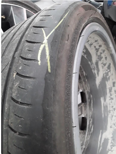
1.1 Slitte sommerdekk. Nye monteres før levering