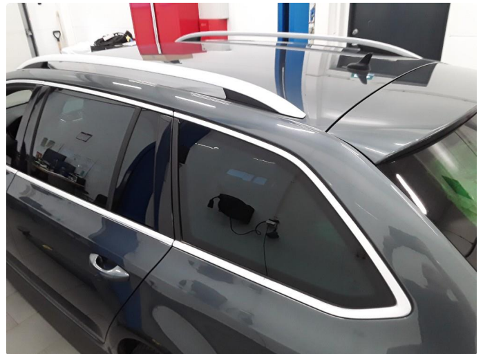
1.3 Noe matt chromebelistning rundt vindusruter og takrails.