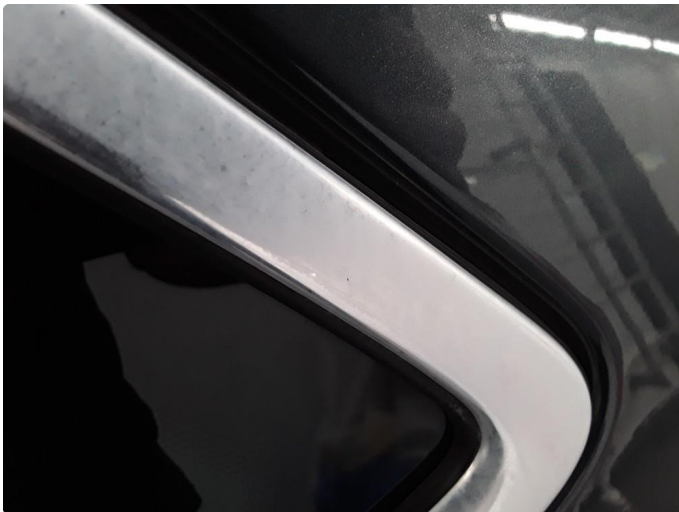
1.3 Noe matt chromebelistning rundt vindusruter og takrails.