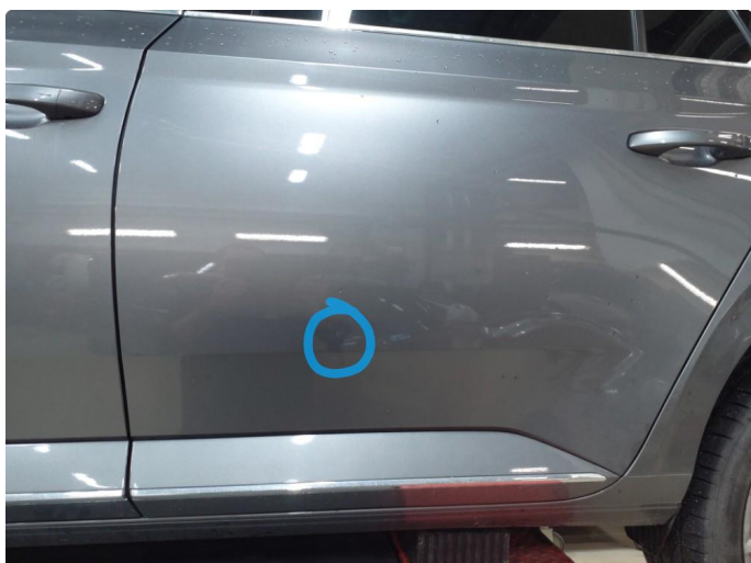
1.2 Bulk med lakkskade