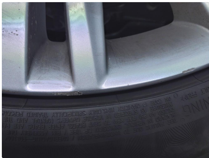
1.4 Kantkjørt felg