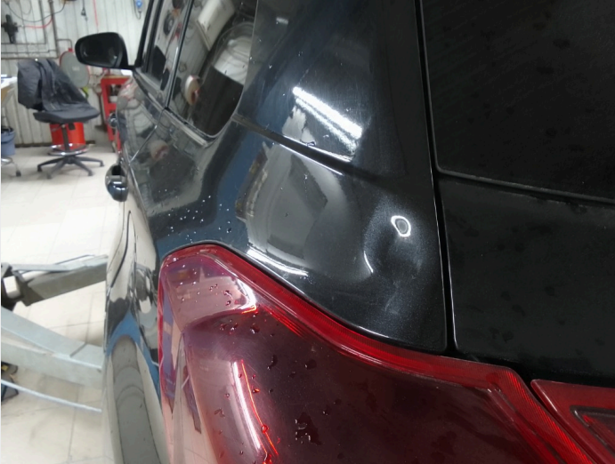
2.7 Bulk venstre bakskjerm