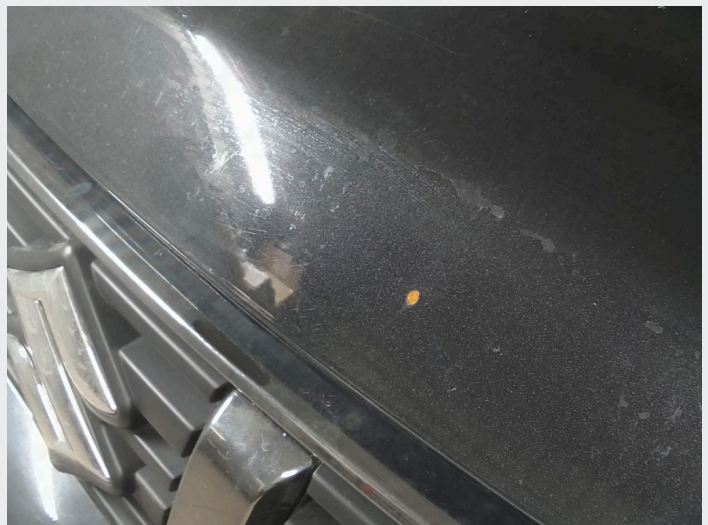
2.3 Rustflek i front