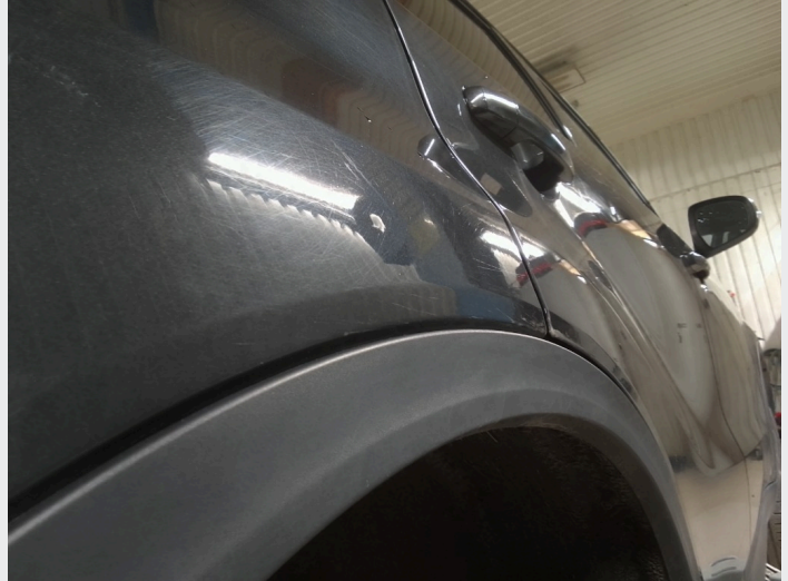
2.7 Bulk høyre bakskjerm