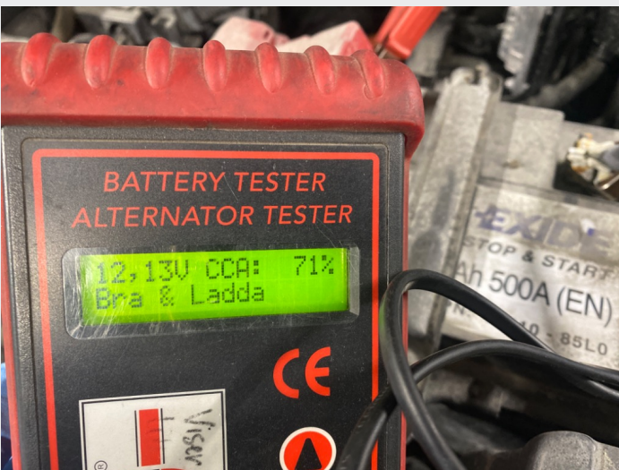
5.2 Batteritest utført