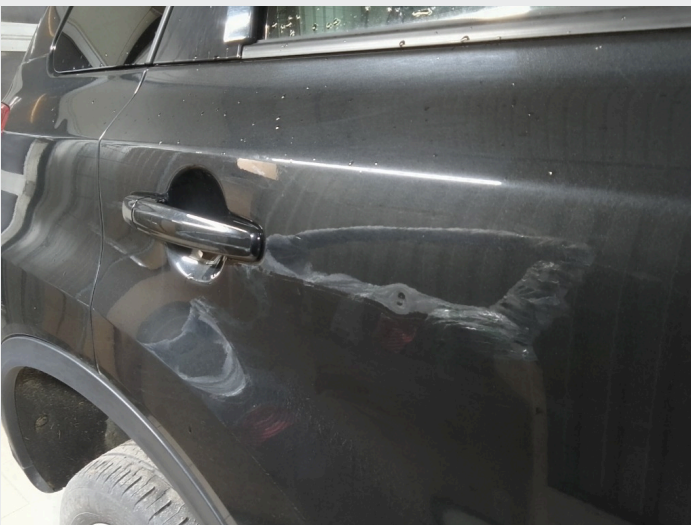
2.5 Bulk høyre bakdør