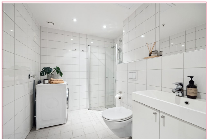
Bad med vaskemaskin, dusj, servant og toalett.