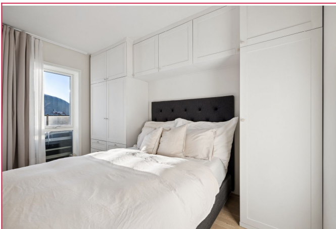
Soverom med mye garderobeskap. Sengen blir stående igjen. Leietaker tar med egen overmadrass.