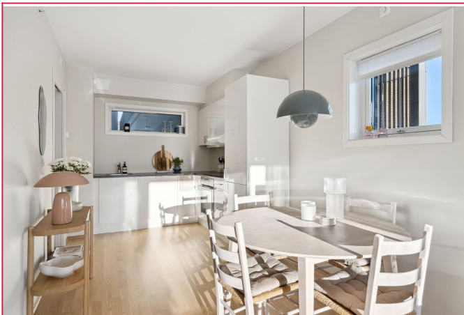
Kjøkkenen med alt av integrerte hvitevarer. Spisestolene blir stående igjen.