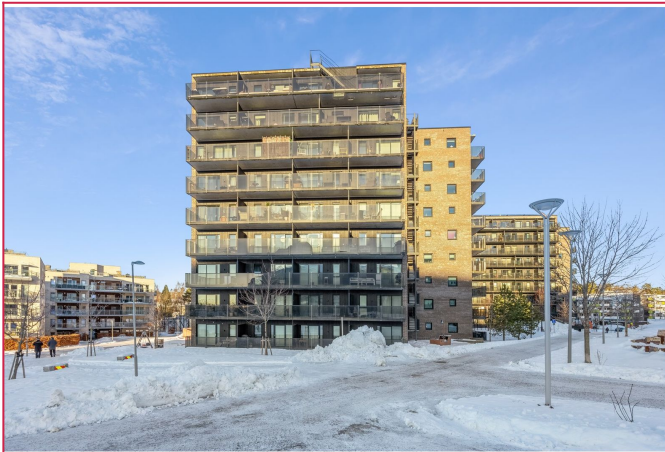
Leiligheten ligger i 4 etg.