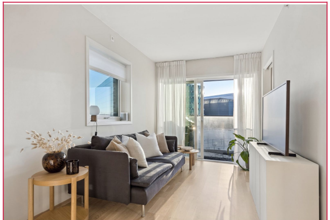
Stue med utgang til balkong. Sofa og tv-benk blir stående igjen.