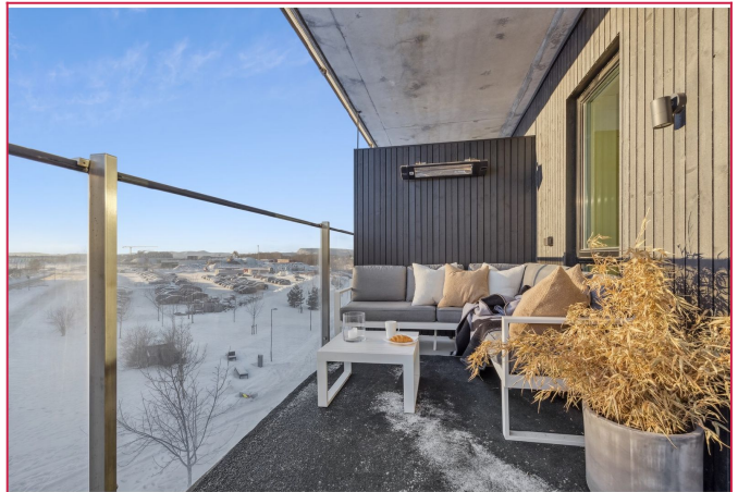
Romslig balkong på 9 kvm med sol på dagtid. Møblene blir stående igjen.