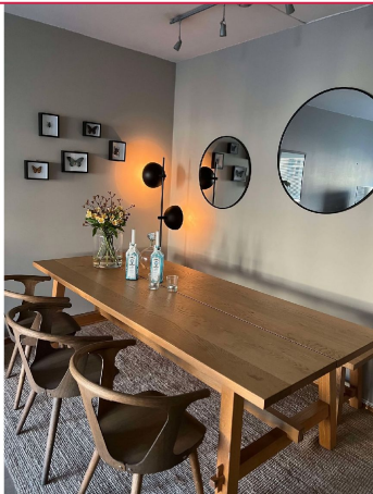
Det er god plass til spisegruppe i stuen.