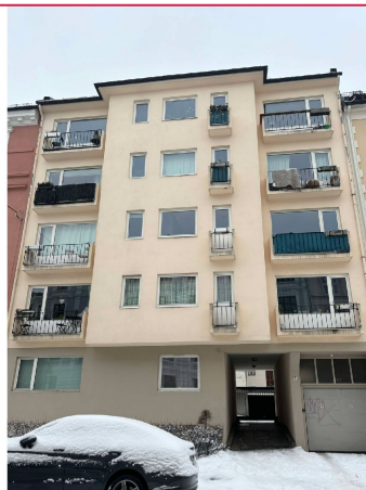
Fasade. Boligen ligger i byggets 4. etasje med balkong.