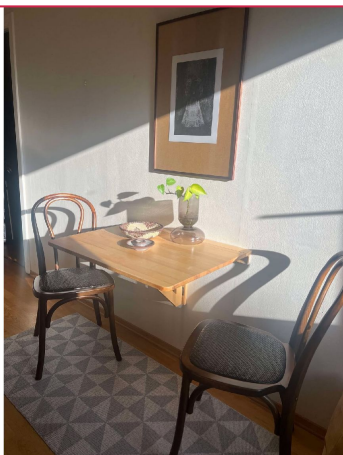
Det er plass til liten spisegruppe på kjøkken.