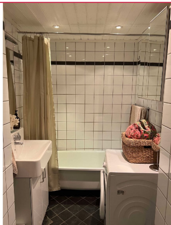
Flislagt bad med badekar.