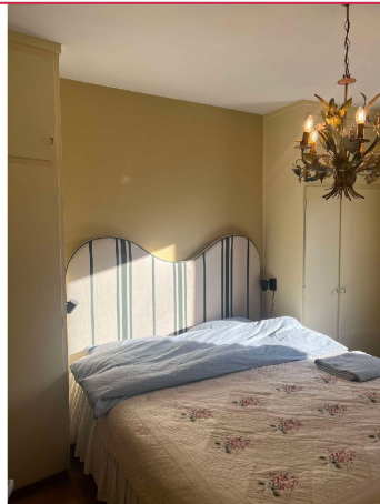
Hovedsoverom med innebygget garderobeskap.