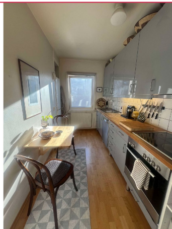
Separat kjøkken med hvitevarer.